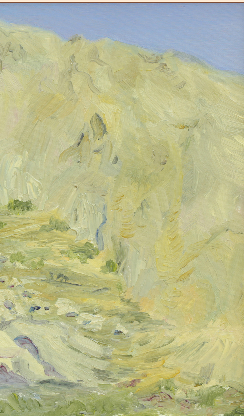
10. Пейзаж о. Сантарини Греция, 2013 Холст, масло 30 x 40 см