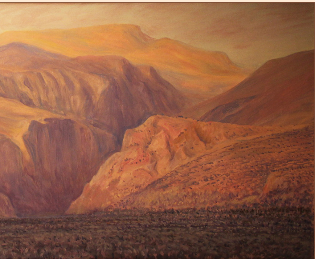
14. Дельфы и св. гора Парнассос, 2016 Холст, масло 120 x 50 см