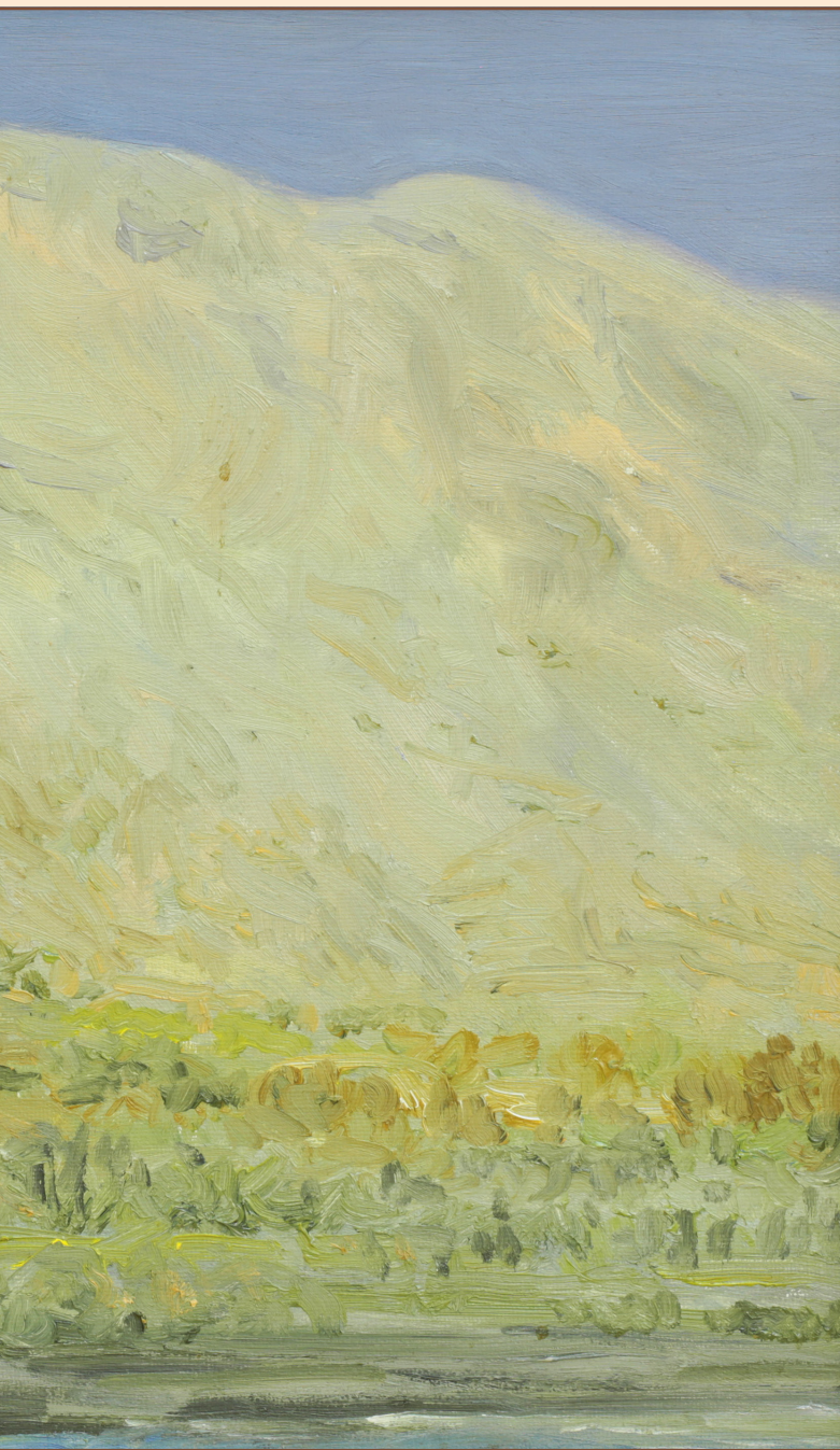
9. Пейзаж Камари о. Сантарини Греция, 2013 Холст, масло 30 x 40 см