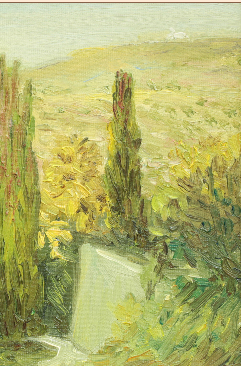
11. Греческий мотив Крит, 2006 Холст, масло 20 x 30 см