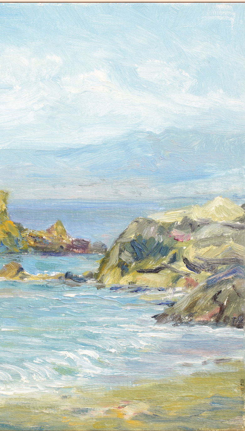
4. Этюд, 2009 Холст, масло 30 x 40 см