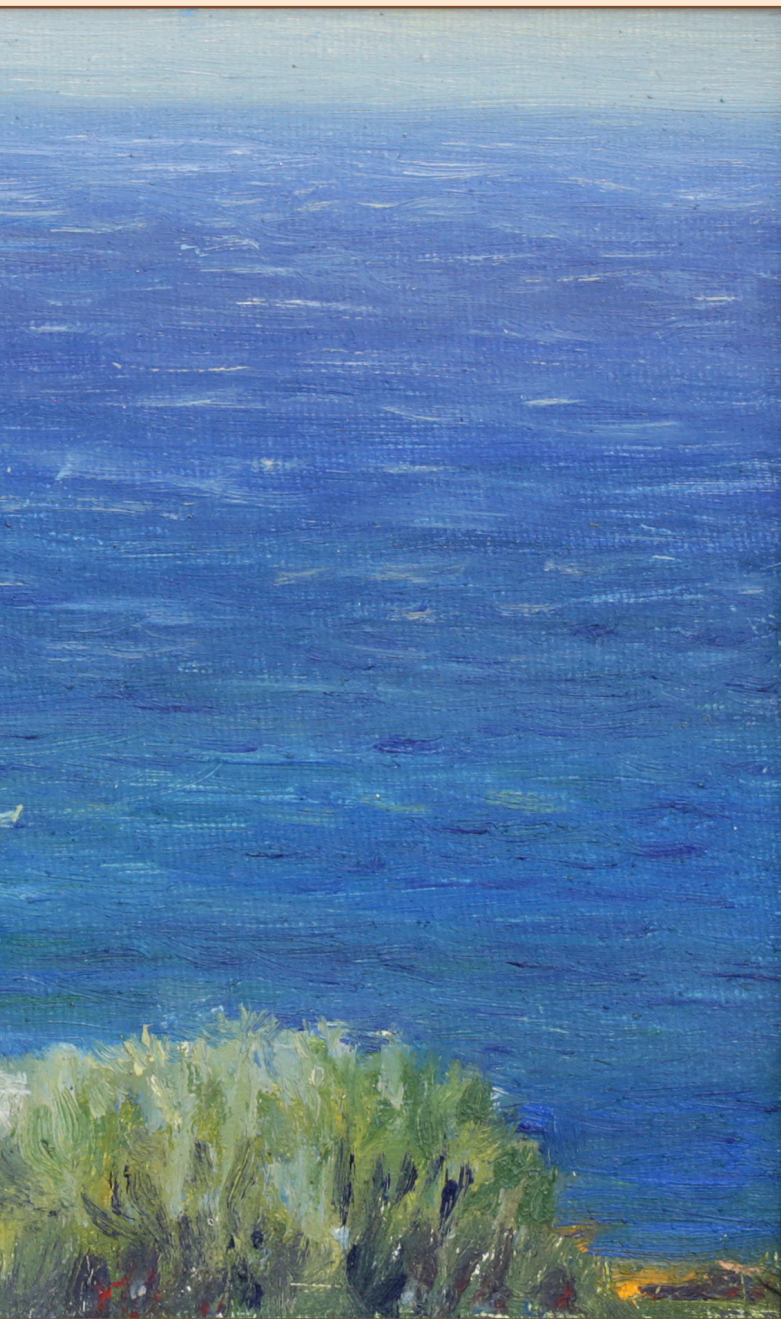
5. Этюд Ливийское море Крит, 2012 Холст, масло 18 x 24 см