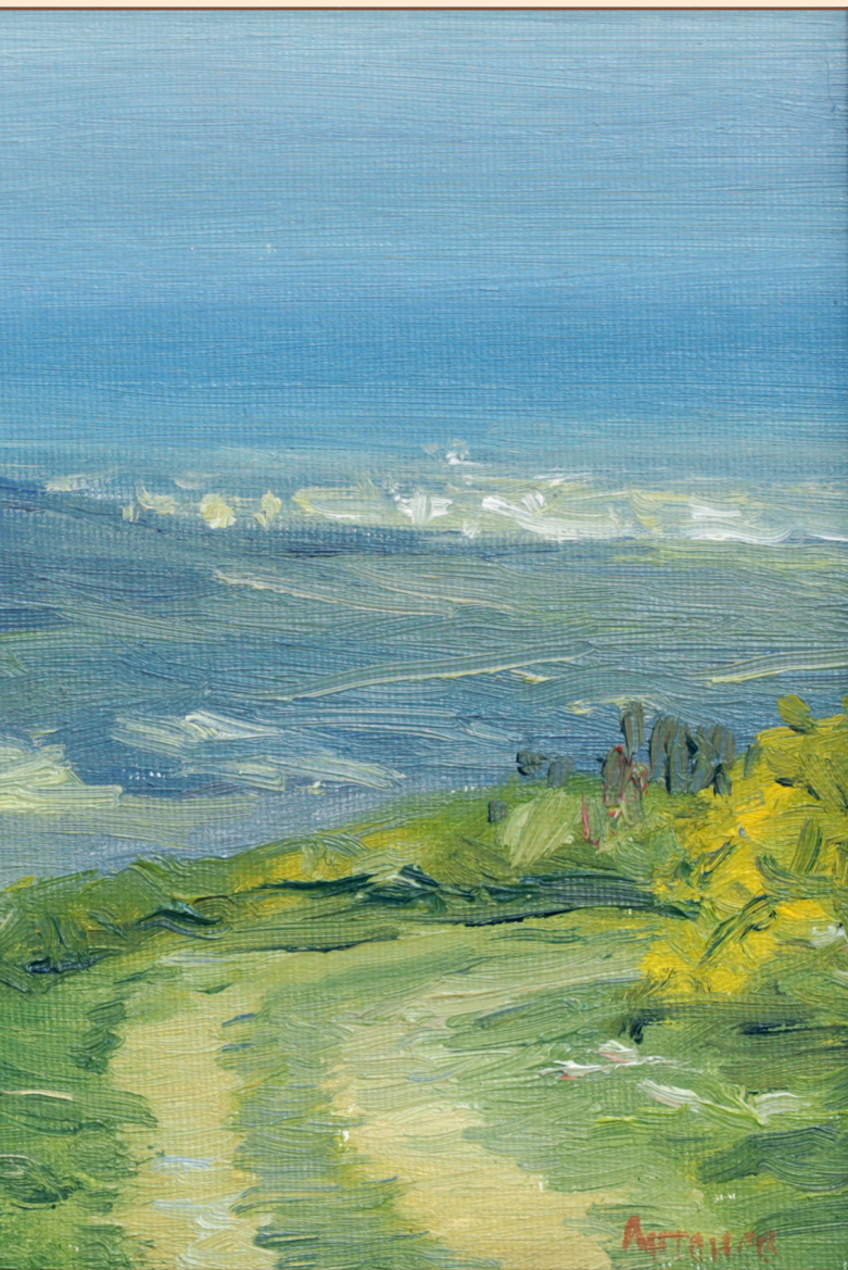
7. Этюд, 2006 Холст, масло 20 x 30 см