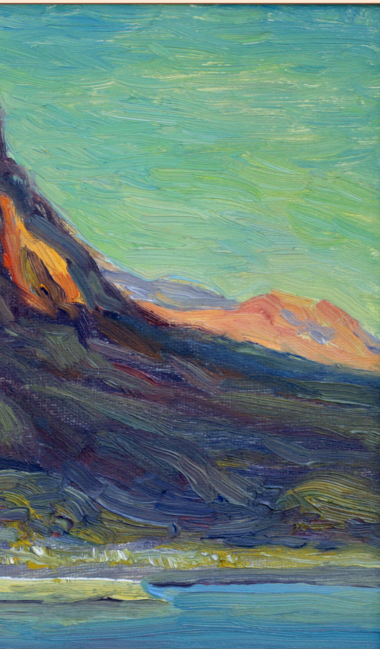
2. Вигла Крит, 2012 Холст, масло 18 x 24 см