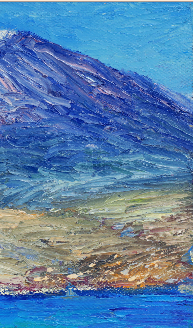
З. Гора Иона, 2015