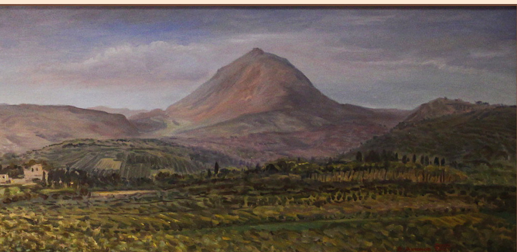
15. Крит. Вид на св. гору Юхтас, 2005 Холст, масло 180 x 48 см