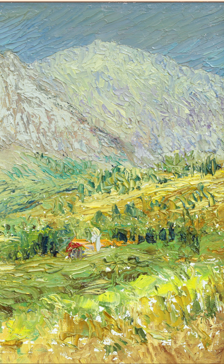
8. Гора Парнассос Греция, 2015 Холст, масло 25 x 35 см