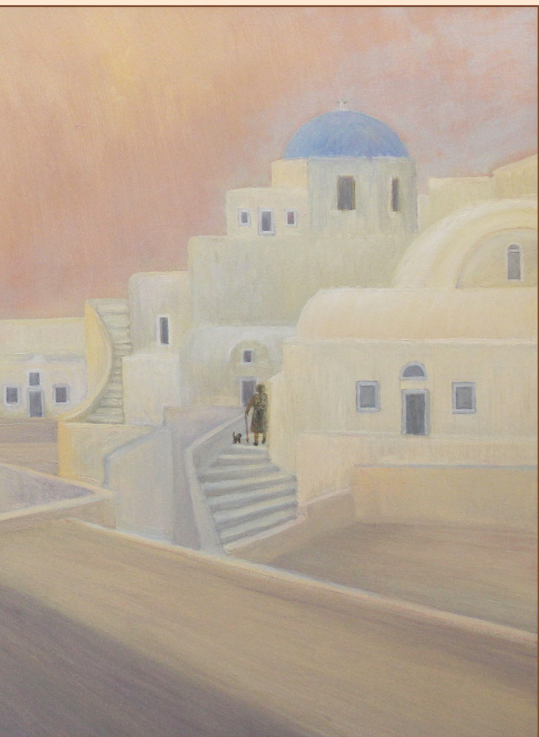
13. о. Санторини, 2015 Холст, масло 90 x 60 см