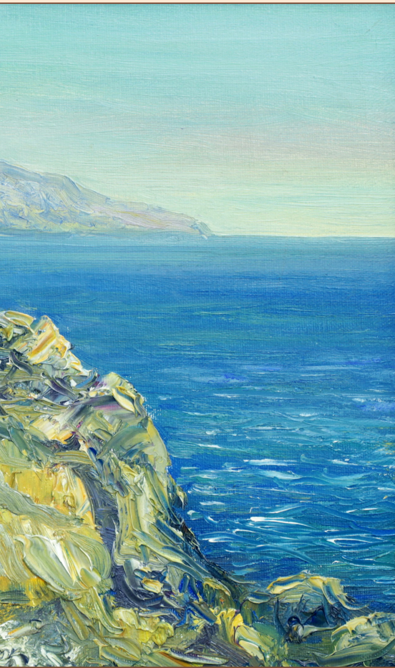
6. Берег южного моря, 2006 Холст, масло 30 x 40 см