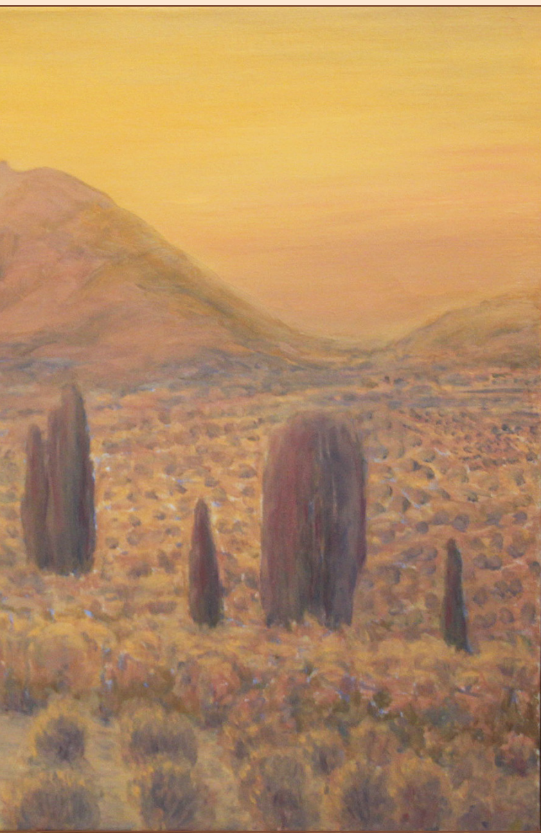
12. Пейзаж со священной горы Юхтас, 2016 Холст, масло 90 x 60 см