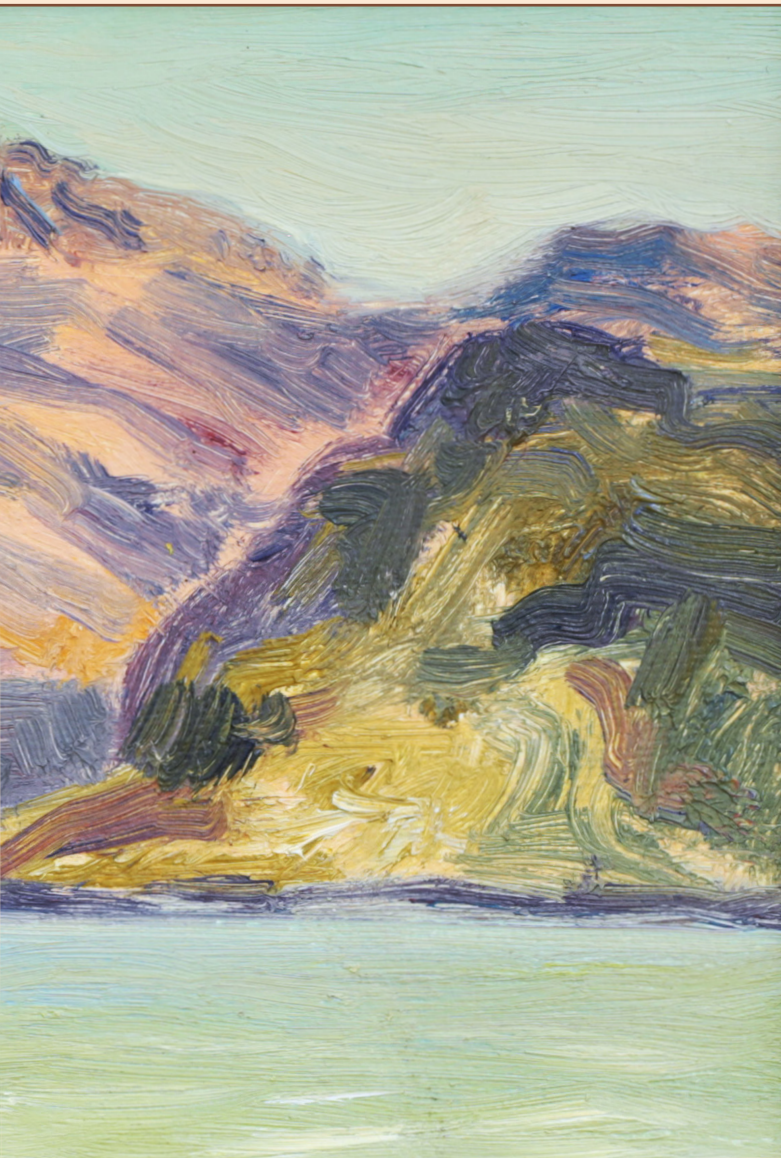
1. Крит, 2012 Холст, масло 13 x 18 см