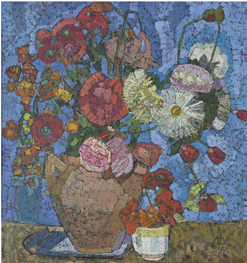
Кат.8. Маки и астры. 1885