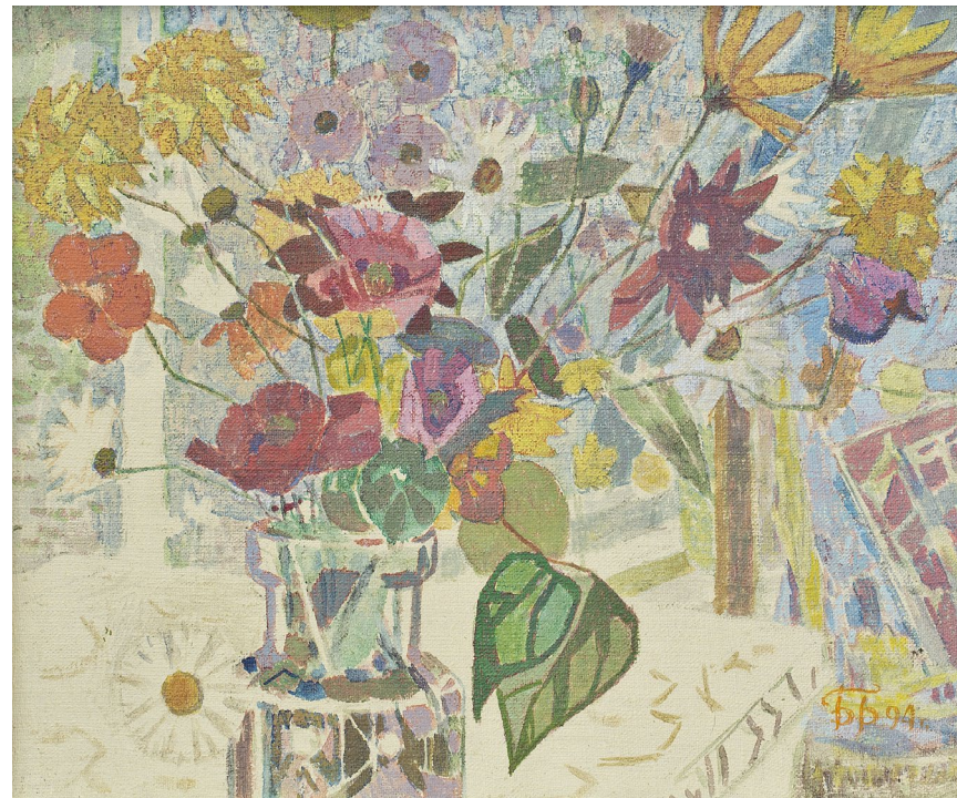
Кат.28. Садовые цветы. 1994