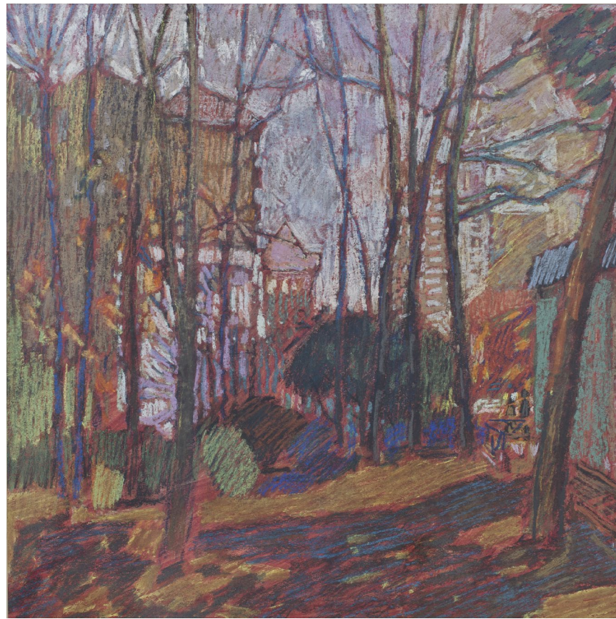
Кат.44. Осень. У кафе «Фрегат». 1995