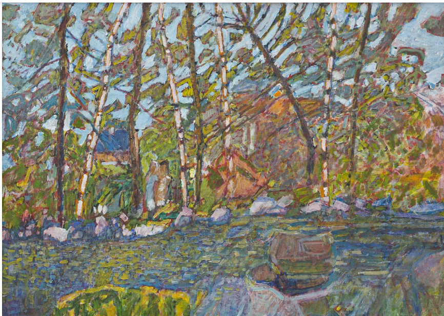
Кат.33. Ручей в деревне Иванов Бор. 2007