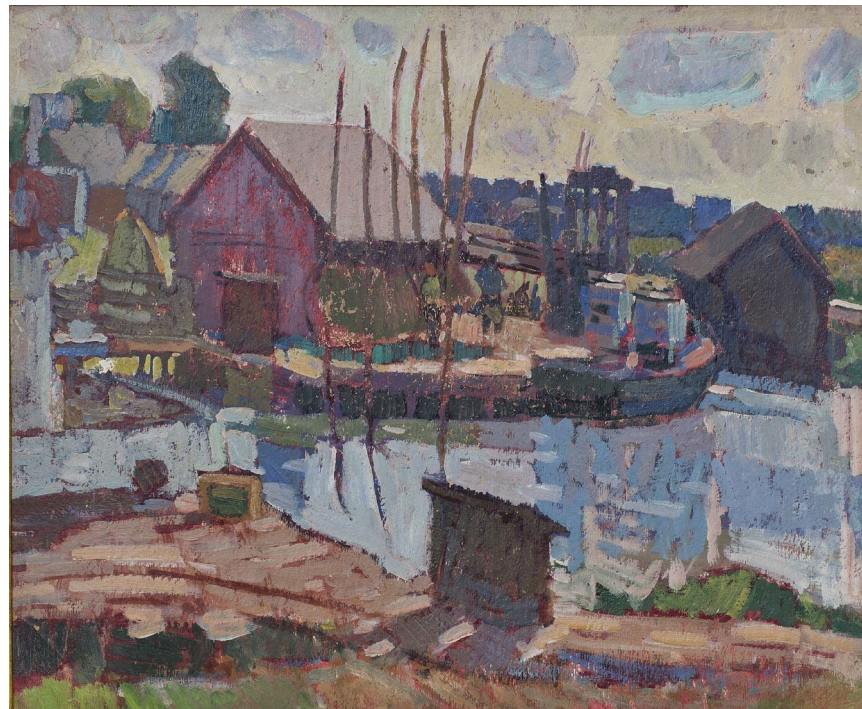
Кат.25. Белозерский район. Река Мазкса. 1980