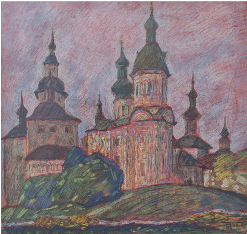
Кат.18. Вечер в Кириллове. 1999