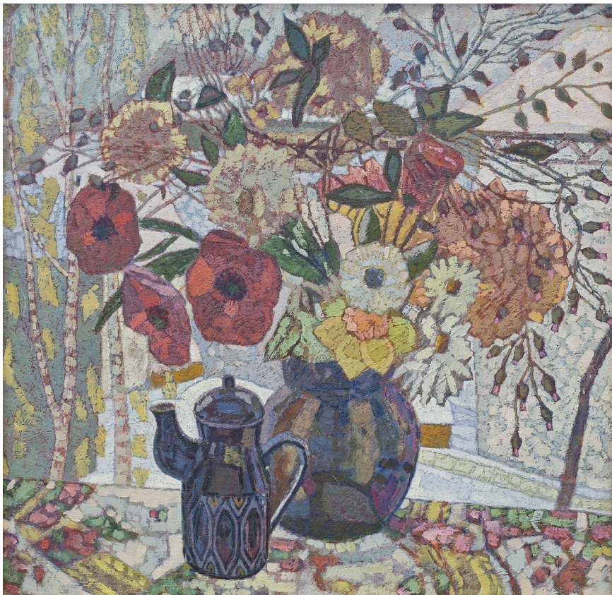
Кат.4. Кофейник и цветы. 1999