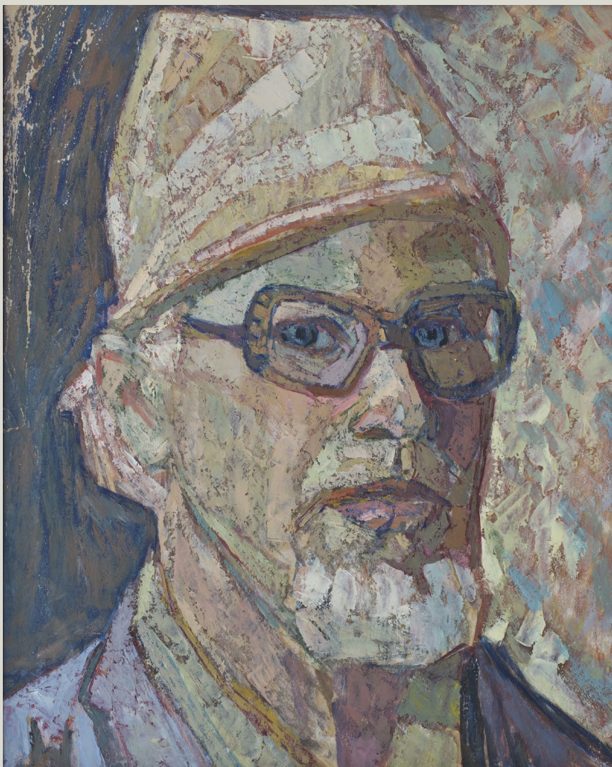
Кат.1. Автопортрет. 1993