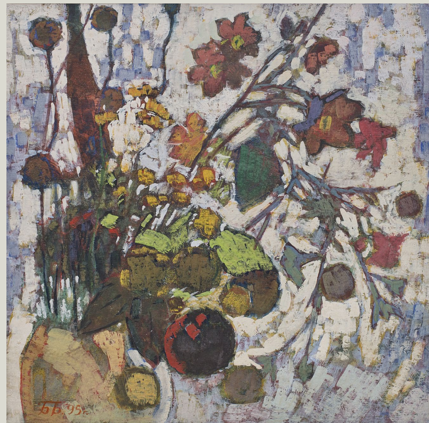
Кат.32. Осенний натюрморт. 2000 →