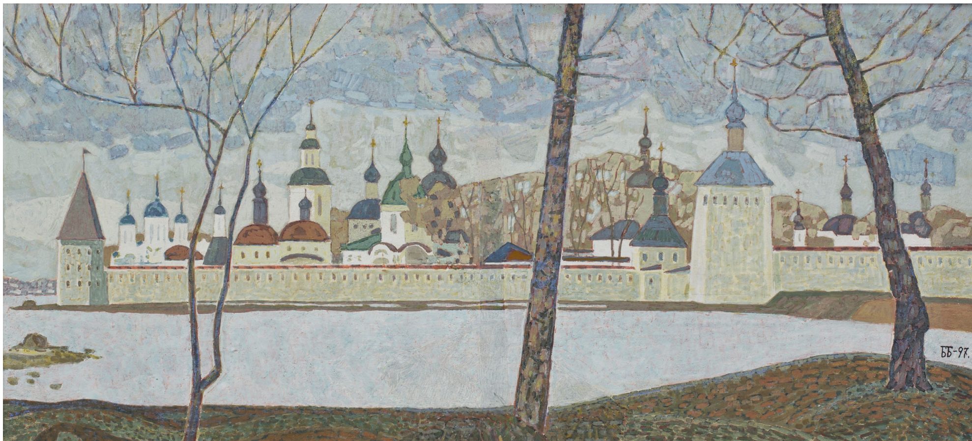
Кат.20. Апрель в Кириллове. 1997