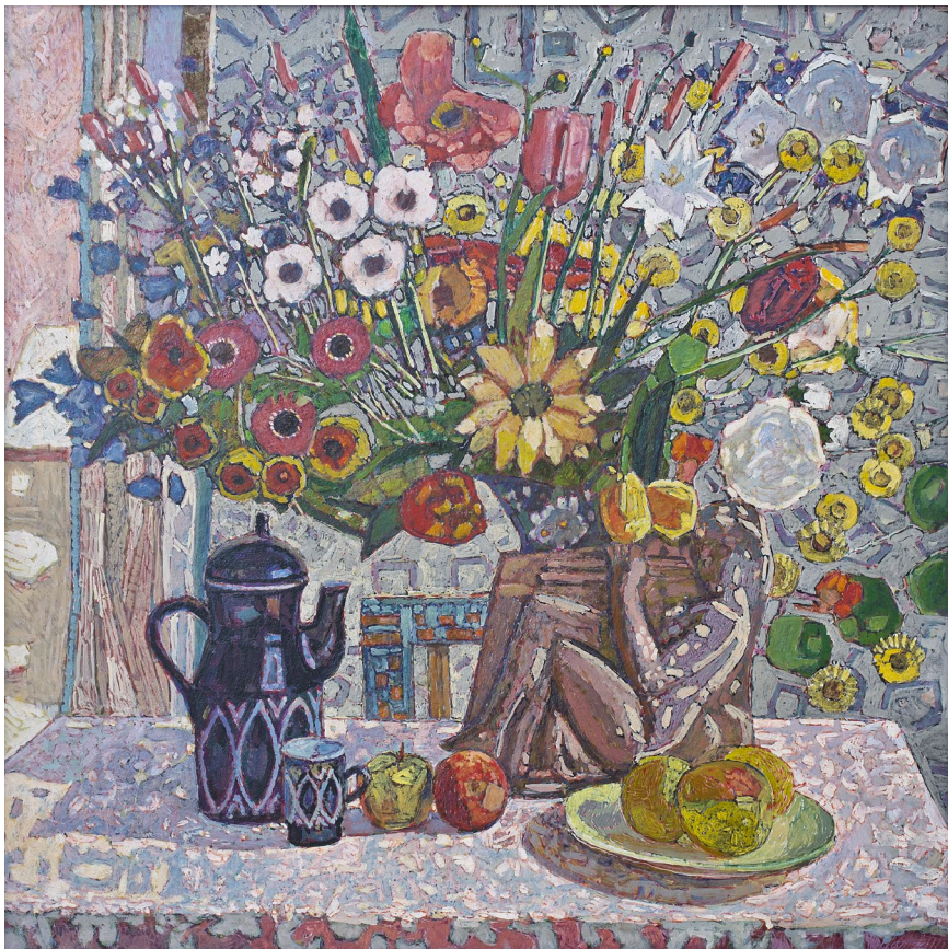
Кат.31. Цветы с барельефом «Играющая на флейте». 1998