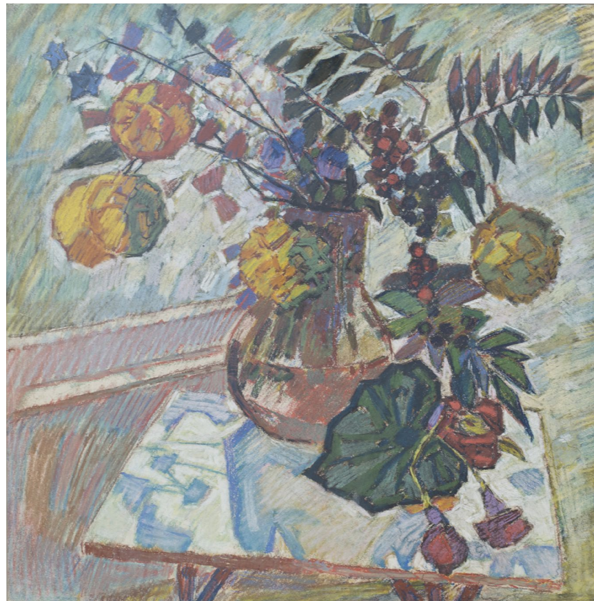
Кат.30. Рябина. 1995