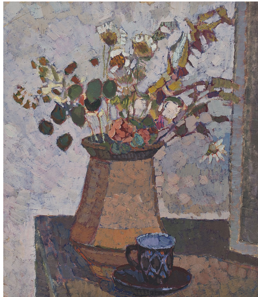
Кат.17. Коричневый кувшин. 2000-е