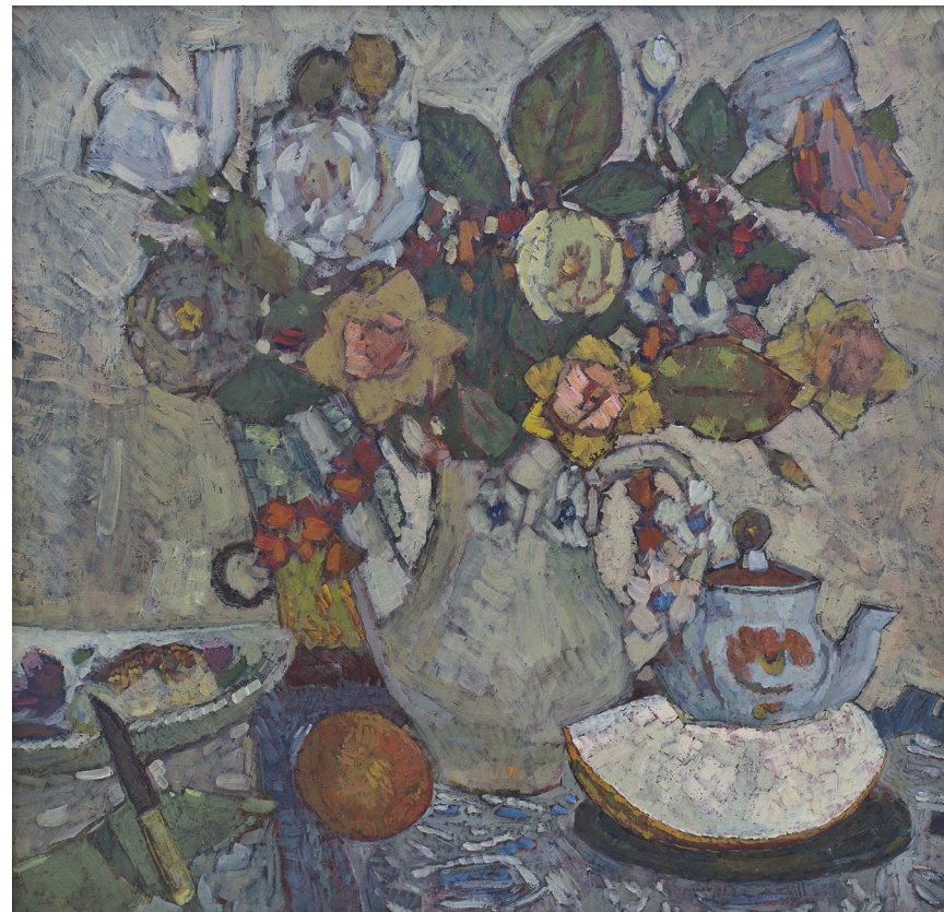
Кат.7. Домашний натюрморт. 2000-е