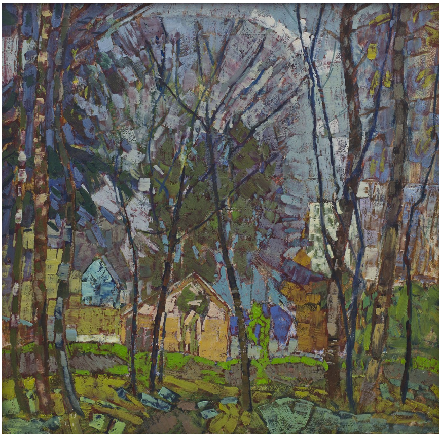
Кат.21. Холодная осень. 2000-е