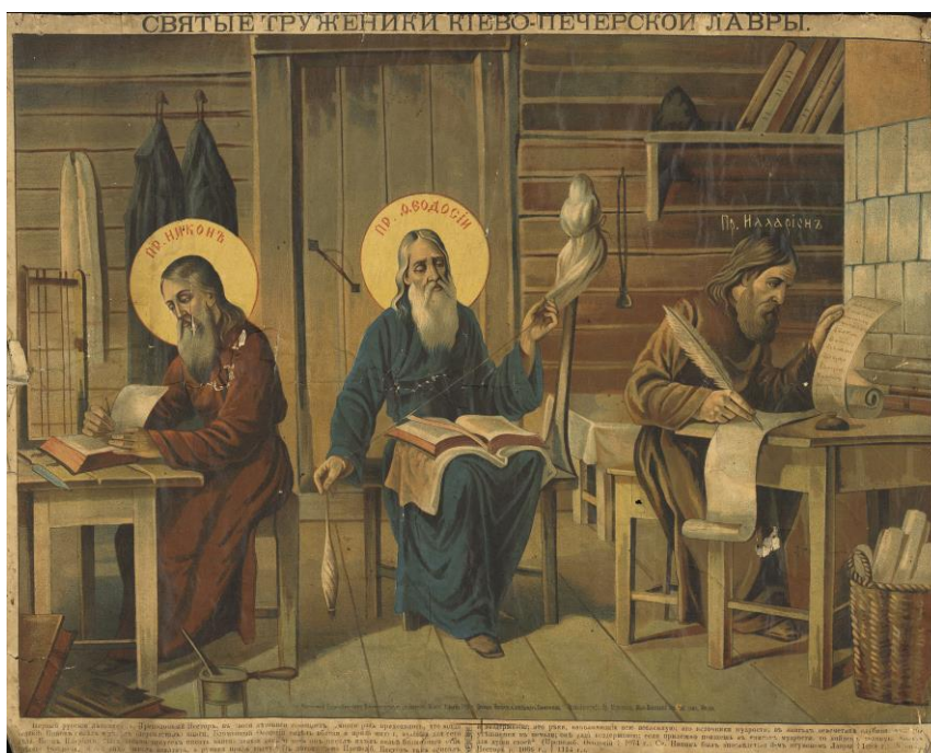
Фото 1 .Лубок «Святые труженики Киево-Печерской Лавры». 1893 год. (КБИАХМ НВ-3858)

Аналогичная хромофотография хранится в фондах Российской Государственной библиотеки (РГБ), данные о ней занесены в электронный каталог главного книгохранилища страны [7]. Лист из РГБ имеет те же размеры название, надписи, данные о типографии, и цензоре, что и лубок из Кирилло-Белозерского музея-заповедника. Таким образом, представленные народные картинки являются отпечатками одного произведения.