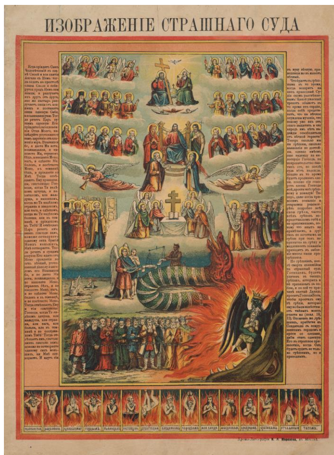
Фото 2. Лубок «Изображение Страшного суда». Начало XX века (КБИАХМ НВ-3857)

Текст, раскрывающий сюжет, напечатан гражданским шрифтом (Фото 2).