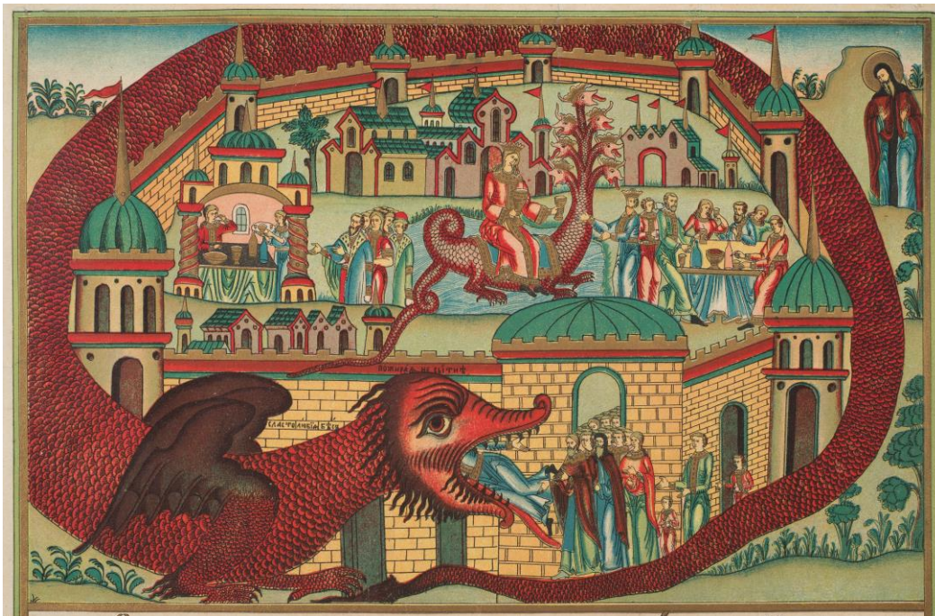
Фото 6. Лубок «О сластолюбии» (фрагмент). Начало XX века. Типография Г.К. Горбунова. г. Москва (КБИАХМ Г-748)

Практическое значение для христиан как старой, так и новой веры имел лубок «Сказание каким святым, каковыя благодати исцеления от Бога даны и когда память их бывает» (КБИАХМ Г-747). На листе в четыре ряда изображены святые, силы небесные, иконы Богородицы. Образы снабжены именными надписями, днями их памяти и почитания, сведениями о том, от каких бед они уберегают и в каких несчастьях помогают человеку (Фото 7). Подобные гравюры появились еще во 2-половине XVIII века и назывались «целебниками».