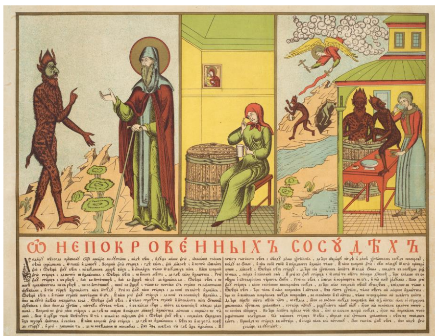
Фото 4. Лубок «О непокрытых сосудах». Начало XX века. (КБИАХМ Г-758)

Гравюра «О непокрытых сосудах» (КБИАХМ Г-758) также не имеет сведений о типографии, но скорее всего она была издана в старообрядческой мастерской (Фото 4). В Национальном музее современного искусства в Париже (центр Жоржа Помпиду) хранится подобная старообрядческая хромофотография из собрания художника В.В. Кандинского. [5, с. 357]. Хромофотография называется «О бесе, оскверненном на блудном месте (доме), и о непокрытом сосуде», была выпущена в московской старообрядческой типографии А.М. Заботина между 1905 и 1914 годами. Гравюры рассказывают об особом отношении старообрядцев к воде, наглядно показывая, что случается с этим источником жизни, если его не оградить от нечистых сил.