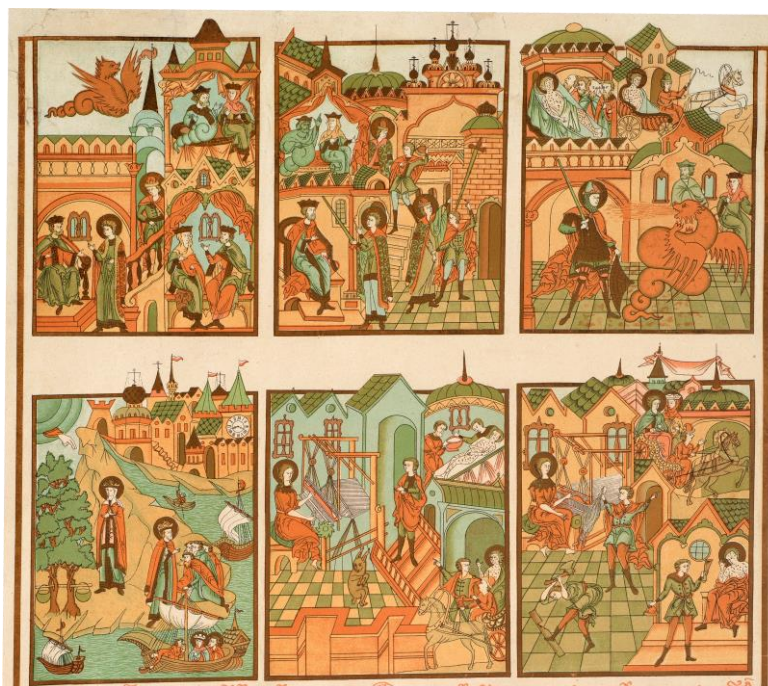
Фото 3. Лубок «Повесть о Петре и Февронии» (фрагмент). Начало XX века. (КБИАХМ Г-753)