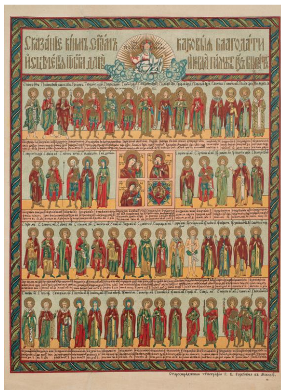
Фото 7. Лубок «Сказание каким святым, каковыя благодати исцеления от Бога даны и когда память их бывает». Начало XX века. Типография Г.К. Горбунова. г. Москва

Практическое значение для христиан как старой, так и новой веры имел лубок «Сказание каким святым, каковыя благодати исцеления от Бога даны и когда память их бывает» (КБИАХМ Г-747). На листе в четыре ряда изображены святые, силы небесные, иконы Богородицы. Образы снабжены именными надписями, днями их памяти и почитания, сведениями о том, от каких бед они уберегают и в каких несчастьях помогают человеку (Фото 7). Подобные гравюры появились еще во 2-половине XVIII века и назывались «целебниками».