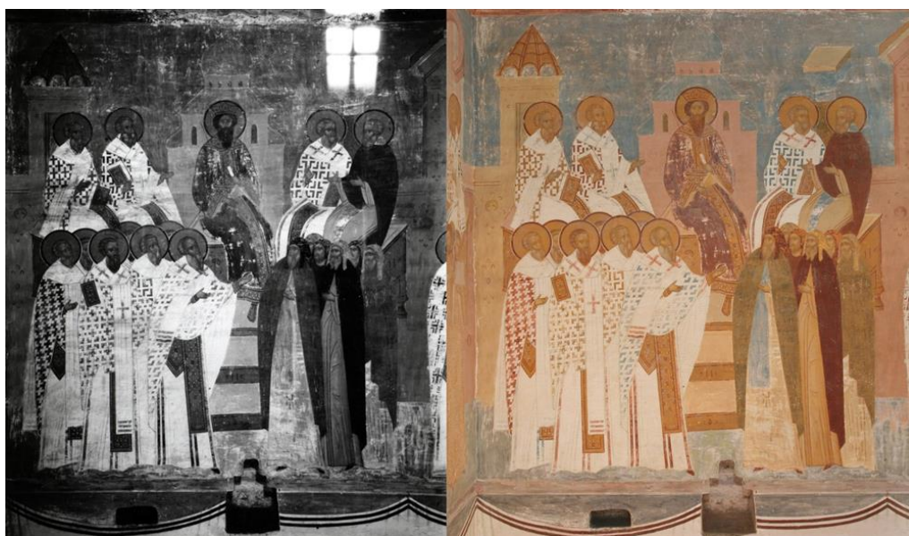
Фотография 3. Шестой Вселенский собор. До реставрации (1985) и после (2006).