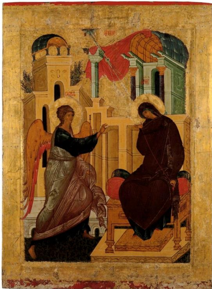
Фотография 2. Икона «Благовещение» XV век. ДЖ-318.

Суздальский музей); «Деисус с предстоящими мучениками Варварой и Параскевой Пятницей» на одной доске из церкви муч. Варвары г. Пскова (вт. пол. XVI в., Новгородский музей), «Параскева Пятница» (1437–1448 г., Ташкентский музей). Участвовала в реставрации икон («Благовещение», около 1497 г.) и позолоты иконостаса Успенского собора и церкви Иоанна Лествичника Кирилло-Белозерского монастыря (Фотография 2).