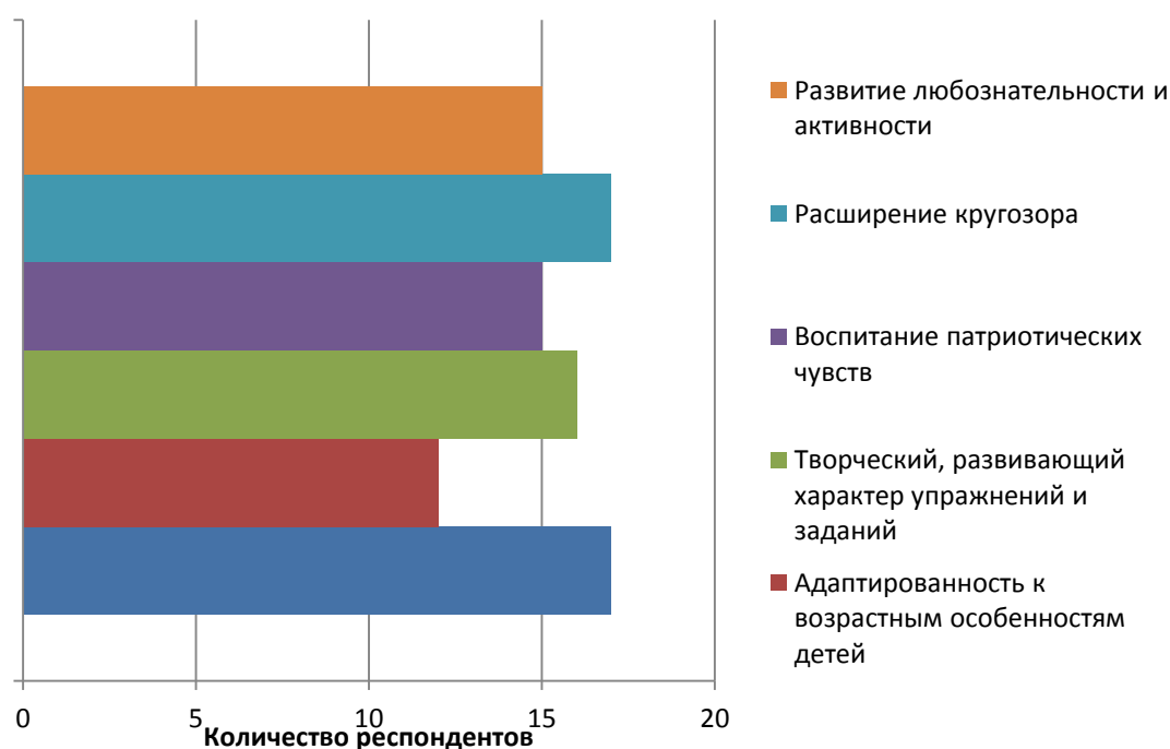
График 1. Положительные качества программы «Знакомьтесь, музей!» по результатам анкетирования

Среди положительных качеств программы методисты и воспитатели отметили ее насыщенность историко-культурной информацией (18 респондентов – 100%), творческий, развивающий характер упражнений и заданий (16 респондентов – 89%), а также тот факт, что занятия способствуют воспитанию у детей патриотических чувств (15 респондентов – 83%), расширению кругозора (18 респондентов – 100%), развитию любознательности и активности (15 респондентов – 83%) (График 1).