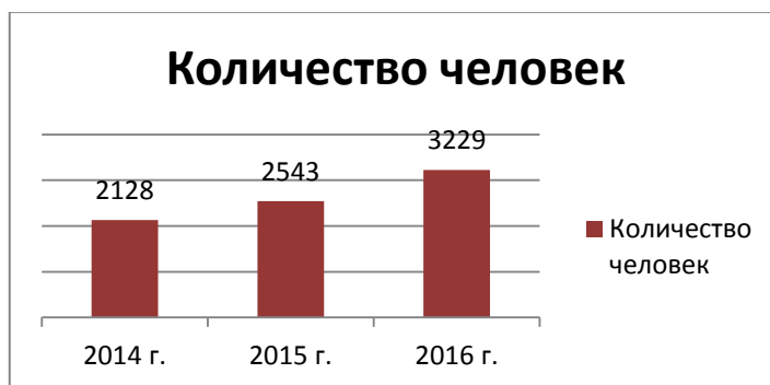
Рис. 2 Количество человек, обслуженных по программе «Знакомьтесь, музей!» в 2014–2016 гг.

Динамика роста количества занятий в 2016 году составила 15% по сравнению с 2015 годом и 43% по сравнению с 2014 годом. Динамика роста количества человек – 19% и 51% соответственно.