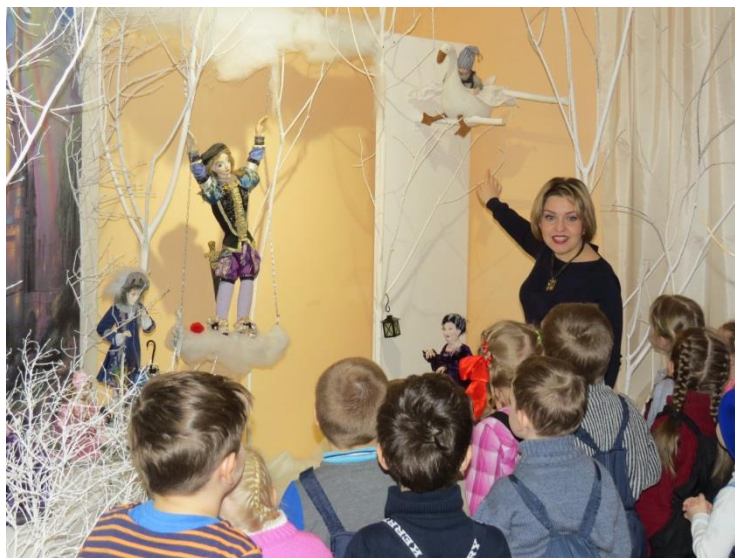
Фотография 1. Экскурсия-путешествие по выставке «Волшебный лес»

Первое знакомство детей с музеем произошло на выставке «Волшебный лес», где представлены авторские куклы, произведения декоративно-прикладного искусства из собрания Кирилло-Белозерского музея-заповедника, Вологодского музея-заповедника, Вологодского областного театра кукол «Теремок» и частных коллекций. Ребята совершили увлекательное путешествие по таинственному зимнему лесу и встретили сказочных жителей: забавных зверюшек, гномов, эльфов, фей, чудо-птиц (Фото 1). Закончилось путешествие просмотром кукольного спектакля «Мороз Иванович», поставленного по мотивам сказки В.Ф. Одоевского. Такая форма работы с дошкольниками на выставке «Волшебный лес» была выбрана неслучайно. Благодаря развитию речи, мышления, памяти, восприятия и, главным образом, воображения ребенок 4–5 лет воспринимает сказку. Именно в этом возрасте очень полезно показывать детям примеры дружбы, доброты, правдивости, трудолюбия, т.к. у ребенка начинает формироваться отношение к окружающим, характер, интересы.