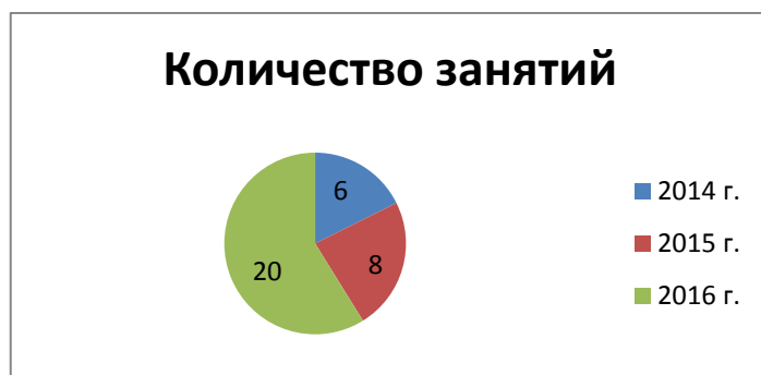
Рис. 3 Количество занятий и экскурсий по программе «Знакомьтесь, музей!» в средних группах в 2014–2016 гг.

Показатели реализации программы в средних возрастных группах в 2014–2016 гг. представлены на рис. 3 и 4.