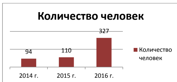
Рис. 4 Количество дошкольников средних групп на занятиях по программе «Знакомьтесь, музей!» в 2014–2016 гг.

В 2016 году проведено 20 занятий для 327 дошкольников средних групп. К концу 2017 года этот показатель планируется увеличить до 60–70, как и ежегодное количество занятий в старших группах (рис. 5). По сравнению с 2014 годом произошло значительное увеличение количества занятий, что привело к увеличению в 3,5 раза количества дошкольников, вовлеченных в программу «Знакомьтесь, музей!».