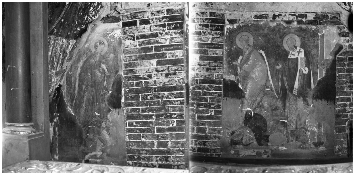
Фото 4, 5. Фрагменты раскрытой композиции 1502 г. в церкви прп. Мартиниана. 1928 год.

В июне следующего года группа реставраторов ЦГРМ вновь едет в Ферапонтово и Кириллов. Ими была проведена промывка фресок в верхних частях собора, удалены поверхностные загрязнения и остатки раствора, а также укреплены трещины в левкасе. После завершения работ ярус лесов под сводами был демонтирован.