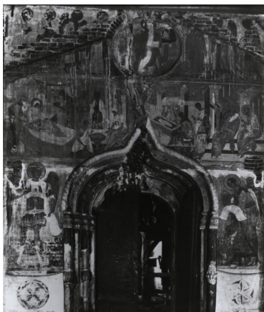
Фото 2. Роспись западного портала собора Рождества Богородицы. Начало XX века.