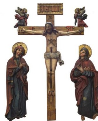
Фотография 5. Распятие с предстоящими. XVIII век

сидящего в скорбной позе Спасителя, заимствованный в XVII веке из западноевропейской культуры, получил широкое распространение в России. Народное толкование евангельской притчи об овцах и козлах (Матф. 25: 31–46) при общем сходстве композиции нашло воплощение в многогранном решении образа страдающего человека. Это находит подтверждение в представленной типологии объемных скульптур полуночного Спаса в музейном собрании. Они отличаются уровнем мастерства исполнения, формами, пониманием сюжета и, как следствие, трактовкой и особенностью передачи чувств в деревянной пластике. Таким примером служит образ сидящего Христа, поступивший из Бородаевской Николаевской церкви Филипповского сельского совета (в настоящее время территория