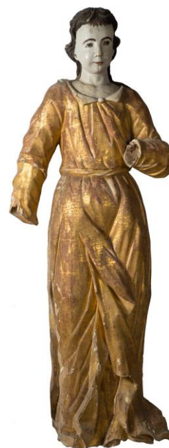
Фотография 7. Скульптура «Ангел». Конец XVIII – начало XIX века

входит в состав Кирилловского района). В коллекции музея – несколько изображений, представляющих образ распятого Христа. Несколько наивно и со значительной экспрессией в технике горельефа выполнена небольшая и компактная композиция «Распятие» XVIII века, вероятно, ранее находившаяся в Казанском соборе города Кириллова ( Фотография 5 ). Практически стоящим на кресте изображен Христос, следы истязаний наглядно представлены на его теле. На страдальческом лице Иисуса, с закрытыми глазами и болезненно приоткрытым ртом, с необыкновенной выразительностью отображены мучения, которые он испытывает. Трагизм происходящего дополняют образы предстоящих. Их эмоциональное состояние отчетливо читается на лицах, в жестах рук и подчеркивается подвижными складками одежд. Объемные позолоченные скульптуры XVIII и XIX веков в стилях барокко и классицизма из иконостасов церквей Кирилловского и Белозерского районов представляют значительную часть музейной коллекции. Четыре ангела, в диаконских одеждах и полностью вызолоченных по полименту (клеящий состав под позолоту, грунт), поддерживали деревянную сень, установленную над ракой преподобного Нила Сорского в 1865 году на средства кирилловской помещицы. Профессионально выполнены скульптуры, поступившие из Никольской часовни деревни Власово, находившейся рядом с Горицами ( Фотография 6 ). Другая группа изваяний – фигуры пророков Моисея, Аарона и двух ангелов – напротив, отмечены архаизмом и провинциальностью