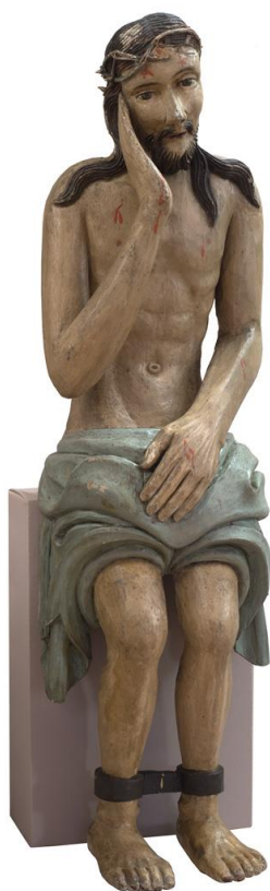
Фотография 4. Скульптура «Христос в темнице». XVIII век