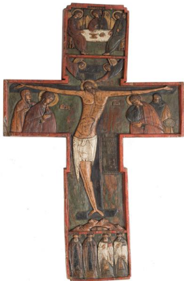
Фотография 8. Крест напрестольный. Начало XVI века

исполнения. Несмотря на попытки создания некого эффекта движения, резчикам не удалось передать выразительность обликов. Они напоминают застывшие маски, сохраняющие невозмутимость и отрешенность. Происхождение скульптур позволил установить снимок С.М. Прокудина-Горского, выполненный в 1909 году в Спасо-Преображенском соборе города Белозерска. Фигуры, считавшиеся утраченными с 1915 года, были элементами