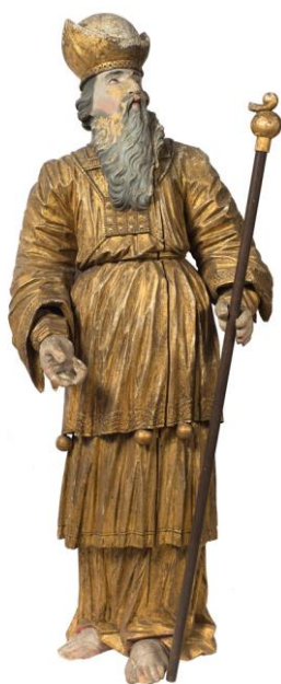
Фотография 6. Скульптура «Первосвященник Аарон». Конец XVIII – начало XIX века

входит в состав Кирилловского района). В коллекции музея – несколько изображений, представляющих образ распятого Христа. Несколько наивно и со значительной экспрессией в технике горельефа выполнена небольшая и компактная композиция «Распятие» XVIII века, вероятно, ранее находившаяся в Казанском соборе города Кириллова ( Фотография 5 ). Практически стоящим на кресте изображен Христос, следы истязаний наглядно представлены на его теле. На страдальческом лице Иисуса, с закрытыми глазами и болезненно приоткрытым ртом, с необыкновенной выразительностью отображены мучения, которые он испытывает. Трагизм происходящего дополняют образы предстоящих. Их эмоциональное состояние отчетливо читается на лицах, в жестах рук и подчеркивается подвижными складками одежд. Объемные позолоченные скульптуры XVIII и XIX веков в стилях барокко и классицизма из иконостасов церквей Кирилловского и Белозерского районов представляют значительную часть музейной коллекции. Четыре ангела, в диаконских одеждах и полностью вызолоченных по полименту (клеящий состав под позолоту, грунт), поддерживали деревянную сень, установленную над ракой преподобного Нила Сорского в 1865 году на средства кирилловской помещицы. Профессионально выполнены скульптуры, поступившие из Никольской часовни деревни Власово, находившейся рядом с Горицами ( Фотография 6 ). Другая группа изваяний – фигуры пророков Моисея, Аарона и двух ангелов – напротив, отмечены архаизмом и провинциальностью