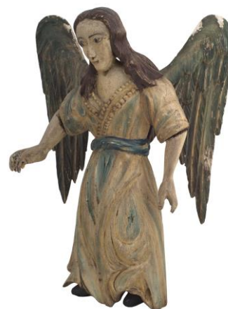
Фотография 3. Скульптура «Ангел». XVIII век

оплачивались и ценились знатоками искусства. Значимые работы монастырского старца – Царские врата и другие крупные предметы – нам известны лишь по документальным свидетельствам. Работа своих мастеров над крупными произведениями была скорее исключением. Как правило, ко всем важным заказам, связанным с художественной резьбой по дереву, привлекались мастера из других городов. В музейном собрании находятся несколько близких этому периоду первоклассных произведений – Царских врат, выполненных резчиками из других художественных центров. Два из них – уникальные памятники декоративного искусства XVI–XVII веков, происхождение которых связано с Успенским собором и церковью Иоанна Лествичника. В XVIII столетии над вычурными новоманерными иконостасами, усложненными скульптурными элементами, работали приглашенные из