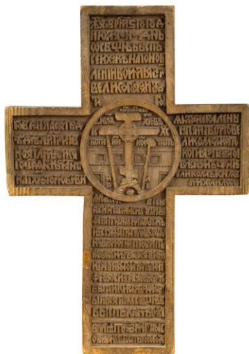
Фотография 1. Крест. 1638 год

библейскими персонажами и сюжетными евангельскими сценами. Образы утратили присущую им ранее статичность, возникла подвижность форм: усложнилась жестикуляция, контуры фигур приобрели S-образные изгибы, которые подчеркивали струящиеся складки