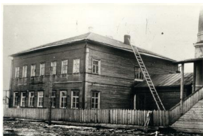
Фотография 11. Деревянное здание городской больницы. Начало XX века. Фото 1930-х годов

Для оказания медицинской помощи населению уезда существовала стационарно-разъездная система. В 1910 году на территории Кирилловского уезда было шесть врачебных участков (городской, Волокославинский, Вашкинский, Петропавловский, Огибаловский, Кречетовский), врачи которых не только вели прием на месте, но и выезжали для помощи больным в села. Кроме шести больниц, имелось также 13 самостоятельных фельдшерских пунктов. В городской больнице, расположенной в двух зданиях на берегу залива Сиверского