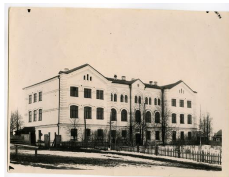
Фотография 4. Бывшее здание уездного Исполкома