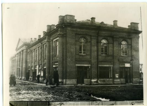
Фотография 3. В этом здании проходил I Кирилловский уездный съезд Советов с 17 по 20 декабря 1917года.

Первый уездный съезд проходил в здании Народного дома. У исполком на первое время для работы занял помещение бывшей уездной земской управы, но в январе 1918 года был переведен в здание бывшего Духовного училища.