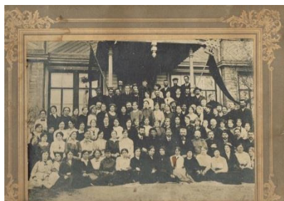
Фотография 10. Группа учителей на крыльце школьного здания у Долгого озера 1920-е годы