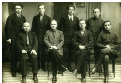
Фотография 5. Члены

В первый период уездные съезды Советов созывались через три месяца. Они имели затяжной характер, было много желающих говорить, отсутствовала какая-либо система в прениях. Организации Советской власти в волостях очень способствовал II уездный съезд Советов, состоявшийся в январе 1918 года. Руководители съезда были те же товарищи, что и на объединенном съезде 17–20 декабря 1917 года. Съезд разрешил много практических вопросов в связи с ликвидацией земства, организацией советского хозяйства и Красной гвардии. III съезд Советов был созван 31 марта 1918 года. На губернские и уездные Советы ложилась огромная и ответственная задача. Они должны были немедленно и самым энергичным образом приступить к завершению работы по организации Советской власти во всех уголках своей территории. Им необходимо было действовать так, чтобы все местные Советы стали действительно органами местной власти. 11 IV уездный съезд Советов,