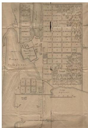
Фотография 7. План города Кириллова 1901 год

Кирилловский уезд был создан по указу Сената 24 августа 1776 года на территории Новгородского наместничества. Центром уезда стал город Кириллов, образованный по указу Екатерины II в 1776 году из подмонастырской слободы Кирилло-Белозерского монастыря. В начале XX столетия Кирилловский уезд занимал обширную территорию, в 2,5 раза превышающую современный Кирилловский район. По данным всеобщей переписи 1897 года, в уезде проживало 120 004 человека, в том числе в городе 4 306 человек (2 062 мужчины и 2 244 женщины) 23 . Изначально Кирилловский уезд относился к Новгородской