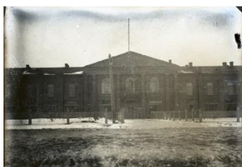
Фотография 9. Народный дом Фото 1935 года

В 1918 году в Кириллове был открыт Народный дом, который стал центром культурной и общественной жизни. Это событие широко освещалось в местной газете «1/14 34 октября в Кириллове состоялось открытие Народного Дома, того Дома, который в своих стенах должен сконцентрировать все то, что необходимо гражданам свободной России для их умственного и нравственного развития. Народный Дом, объединяющий всех граждан, жаждущих света и