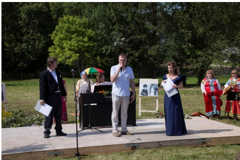
Фотография 1. Открытие праздника