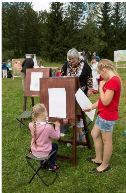
Фотография 7. «Ильинский пленэр»

Любители живописи, как впрочем, и любой желающий создать маленький шедевр под открытым небом, имели возможность присоединиться к «Ильинскому пленэру» и нарисовать красками или карандашом церковь Илии Пророка, чей-то портрет или живописный пейзаж. Работы художников могли оценить все гости праздника.