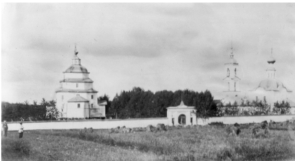
Фотография 4. Вид на церковь Илии Пророка и церковь Дмитрия Солунского. 1909 год