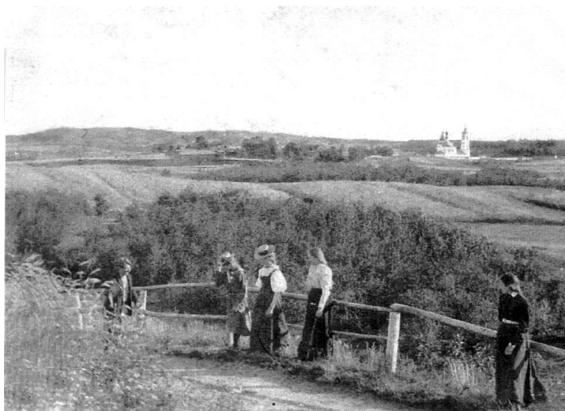
Фотография 5. У часовни Александра Невского на Цыпиной (Роскиной) горе. Начало XX века

«Ильинские гуляния» на Цыпино – это мероприятие, ориентированное на разные категории населения. Каждый может выбрать здесь для себя занятие по душе и по настроению. Особый интерес у детей и взрослых вызвала уличная экспозиция «Сторона Родная», где можно было не только узнать историю уникальных предметов быта жителей Цыпинской деревни, но и потрогать все своими руками.