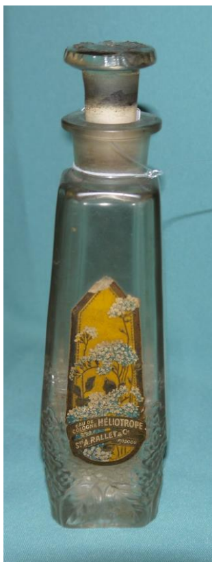
16. Флакон от «Гелиотроп» (К-2619) духов на выставке «Мир старого дома»

На выставке «Мир старого дома» так же представлен флакон «A. Rallet & C» с остатками превратившегося в кристаллы одеколора «Гелиотроп», изготовленного на фабрике в Москве (К-2619). У бутылочки из матового стекла хорошо сохранилась стеклянная притертая пробка и этикетка с надписями: «Heliotrope», «A. Rallet & C».