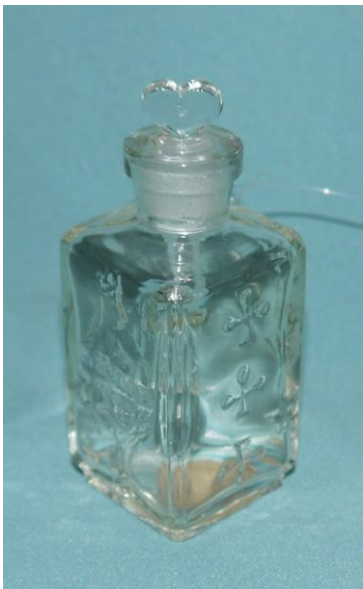
20. Флакон от духов «Пиковая дама» (К-2621) на выставке «Мир старого дома»

довольно дешево и были доступны большей части населения.