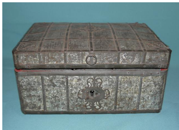
5. Шкатулка из фонда Кирилло-Белозерского музея-заповедника, выполненная в технике «Мороз по жести» (М-879)

Великий Устюг – один из древних русских городов, где получили развитие различные народные промыслы. Он известен и как центр художественной обработки металла. В музее хранятся шкатулки, исполненные в технике, которая имеет название «мороз по жести». Этот народный промысел возник в Великом Устюге в конце XVIII века. Шкатулки из дерева, обитые серебристыми и золотистыми желяными переливающимися пластинами,