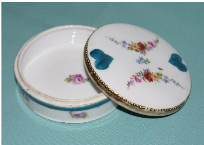
3. Фарфоровая коробочка (К-2690) на выставке «Мир старого дома»

Привлекает внимание довольно простая, но оригинальная шкатулка, находящаяся в музее на выставке «Мир старого дома». Это изделие имеет форму изящно изогнутого сердца (ВХ-5061). Стенки шкатулки украшены незатейливой резьбой и покрыты бесцветным лаком. На ее крышке в центральной части закреплена подушечка из малинового бархата, куда крепятся