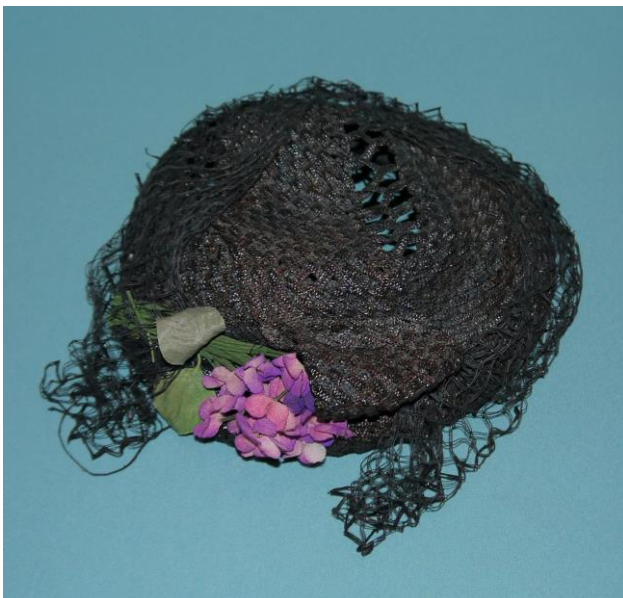
10. Шляпка (НТ-3265) на выставке «Мир старого дома»

мешочки отличались по форме и отделке, что определяло социальное положение их хозяйки. Украшенные вышивкой, драгоценными камнями, жемчугом, они имели не только утилитарное значение, но и дополняли дамский туалет.