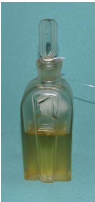
22. Флакон от духов «1 Мая» (К-2622) на выставке «Мир старого дома» из собрания Кирилло-Белозерского музея-заповедника

Мая», выпускаемых в 1960-е годы. На его лицевой части хорошо читается цифра «1», такая же, как ее изображали на первомайских открытках и плакатах.