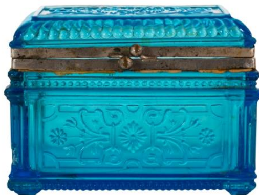
2. Шкатулка из фонда Кирилло-Белозерского музея-заповедника (К-1589)

В музее хранятся деревянные шкатулки, декорированные в различной технике: роспись, резьба, резные берестяные накладки.