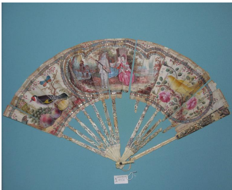
12. Веер (НТ-3297) фондов Кирилло-Белозерского музея-заповедника

Веера искусно изготавливали в России, а также импортировали из-за границы. В разное время у разных народов веер обретал разные формы и конструкции. Делали веера из различных материалов, используя растения, перья птиц, пергамент, дерево, ткань, слоновую кость, перламутр, драгоценные металлы и пр.