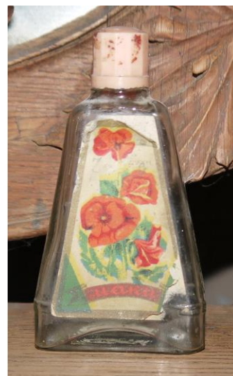
19. Флакон от духов «Маки» (К-1778) в экспозиции Музея Истории города Кириллова и Кирилловского района музея-заповедника

Духи и одеколон «Кармен» впервые появились в 1920-е годы, в 1930-е они стали особо популярны из-за солидарности к испанцам, на родине которых в этот период началась гражданская война. Духи производили вплоть до 1970-х годов, стоили они