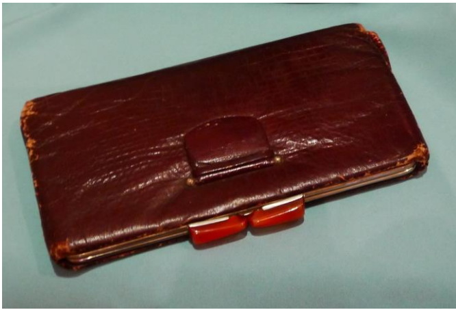
9. Сумка-клатч (НТ-3268) на выставке «Мир старого дома»

Первоначально бисер и стеклярус привозили из Европы. В России производство бисера началось в 1754 году, когда при участии М.В. Ломоносова в Усть-Рудице близ Петербурга была организована фабрика. К сожалению, это производство просуществовало не долго, после смерти Ломоносова в 1765 было закрыто.