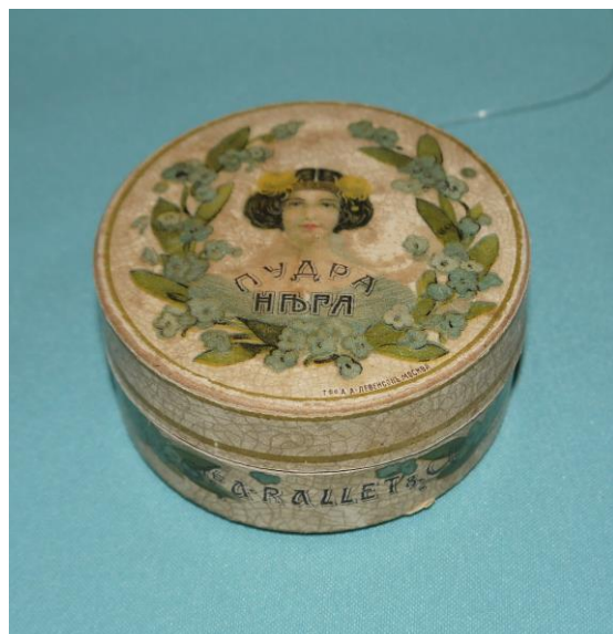
13. Коробочка от пудры производства фирмы «A. Rallet & C» (BX-5058) на выставке «Мир старого дома»

В XIX – начале XX столетий популярностью у европейских модниц пользовалась французская пудра «La Veloutine» (Вильветин) и жирная берлинская пудра крупнейшего в то время производителя театрального грима компании «Leichner» (Лейхнер). В России в мире парфюмерии лидировало Товарищество «A. Rallet & C» (А. Ралле и К).