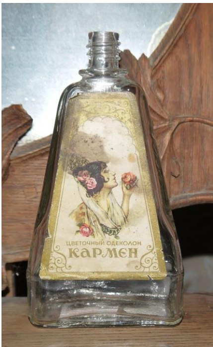
18. Флакон от одеколона «Кармен» (К-1664) в экспозиции Музея Истории города Кириллова и Кирилловского района музея-заповедника

В то время, когда во Франции в 1921 году появились Chanel № 5, в России из национализированных заводов был создан Союзный трест высшей парфюмерии, жировой, мыловаренной и синтетической продукции «Жиркость». Логотипом треста служили две соединенные литеры в виде букв «Т» и «Ж», также использовались надписи: «Тэжэ», «ТЭЖЕ».