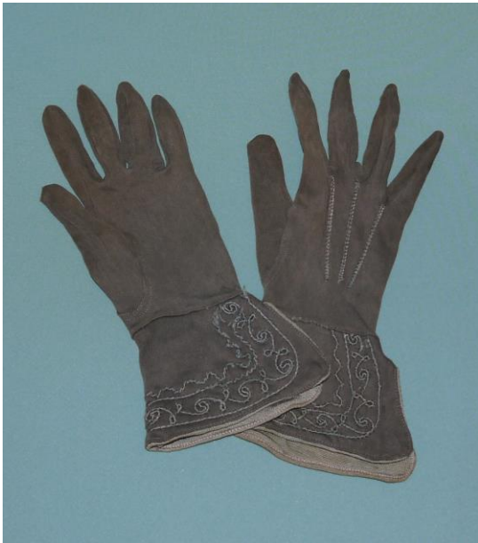
11. Перчатки (BX-5096/1-2) на выставке «Мир старого дома»

Фотографии 1900-х годов свидетельствуют о том, какое разнообразие фасонов головных уборов было в это время. В XX столетии модницы также продолжали носить шляпки, которые порой представляли собой довольно экстравагантные экземпляры.