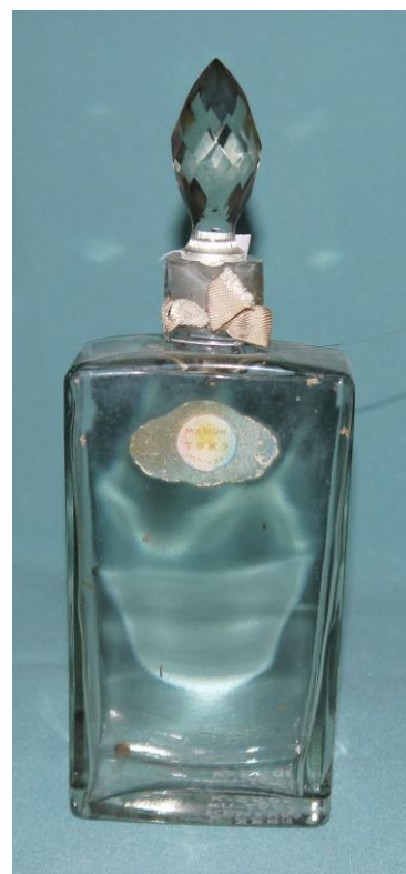
17. Флакон от духов «Манон» (К 2595) на выставке «Мир старого дома»

Среди парфюмерных флаконов на выставке «Мир старого дома», обращает на себя внимание находящаяся на туалетном столике прямоугольная бутылочка с граненой остроконечной пробкой и бежевой атласной ленточкой, повязанной бантом на горлышке (К 2595). Внутри флакона еще сохранится нежный аромат содержимого. На этикетке в верхней части флакона надпись: «Манон. Тэжэ».