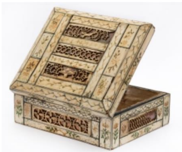
4. Шкатулка из фонда Кирилло-Белозерского музея-заповедника (К-22)

вновь открывали. Клейма на изделиях менялись несколько раз за всю историю существования предприятия.