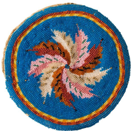
7. Футляр для пудреницы (НТ-2495) из коллекции Кирилло-Белозерского музея-заповедника

Такие украшения, датируемые XI–XIII веками, есть в коллекции Кирилло-Белозерского музея-заповедника. Так же как и костяное ожерелье, они показаны в экспозиции музея «Древности Белозерья».