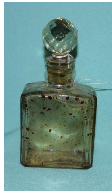
21. Флакон от неизвестного парфюма (К-2594) на выставке «Мир старого дома»

В коллекции керамики музея хранится множество флаконов без этикеток из-за чего довольно сложно определить, какое содержимое в них находилось. Прямоугольная бутылочка с круглой граненой пробкой (К-2594) очень схожа с флаконами от духов «Магнолия», «Душистый горошек», выпускаемыми в такой упаковке предприятием «ТЭЖЭ» в 1930-е годы. Флакон, стилизованный под столичную высотку (НВ-12963) по всей видимости, от духов «Юбилей», производимых с 1953 года на фабрике «Новая заря». Флакон с сохранившимся содержимым, из матового желто-зеленого стекла с притертой стеклянной пробкой (К-2622) очень схож с бутылочками от духов «1