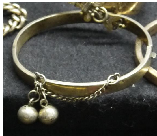
6. Браслет в экспозиции Красносельского музея ювелирного и народно-прикладного искусства

Одними из древнейших и самых популярных женских украшений являются бусы – украшения, состоящие из элементов со сквозным отверстием, носимые в виде ожерелий. Первые бусы из костей животных появились еще в палеолите. В экспозиции Кирилло-Белозерского музея-заповедника «Древности Белозерья» представлено ожерелье из зубов животного эпохи мезолита относящиеся к 9–8 тыс. до н.э. (В/Х-3886)