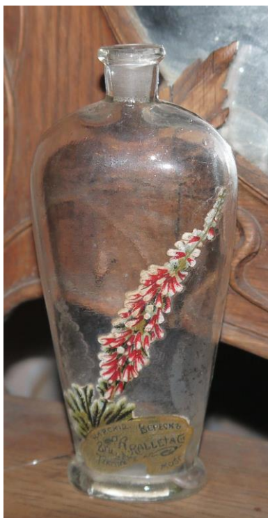
14. Флакон от духов «Царский вереск» (НВ-1996) в экспозиции Музея Истории города Кириллова и Кирилловского района

В музее храниться круглая картонная коробочка от пудры производства фирмы «A. Rallet & C» (BX-5058), изготовленная на фабрике в Москве в конце XIX – начале XX столетий, о чем свидетельствует надпись на крышке пудреницы: «A. Rallet & C».