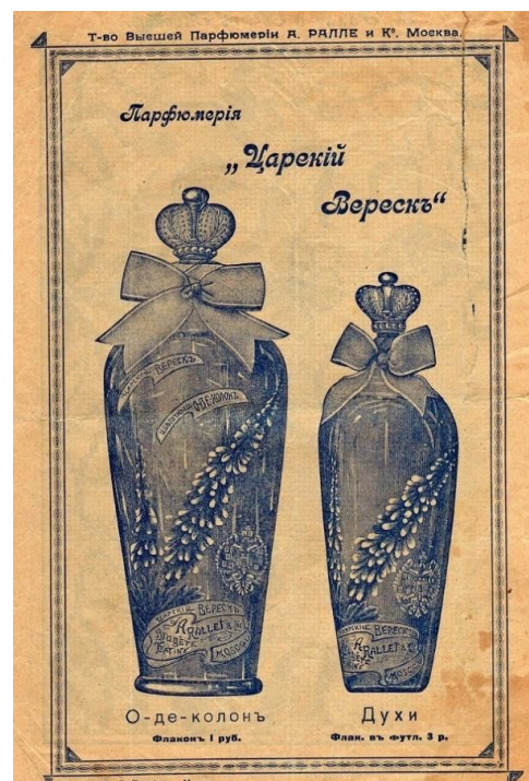
15. Фотокопия рекламного плаката парфюма «Царский вереск», выпускаемого в конце XIX – начале XX столетий

В экспозиции Музея Истории города Кириллова и Кирилловского района экспонируется бутылочка из под духов «A. Rallet & C» «Царский Вереск» (НВ-1996). Хорошо сохранилась этикетка на флаконе, но оказалась утрачена крышка. Представление о том, как она могла выглядеть (в виде короны Российской империи), можно составить, взглянув на рекламный плакат этих духов, выпускаемый в конце XIX – начале XX столетий.