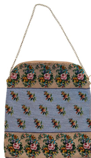
8. Сумочка (НТ-2496) из коллекции Кирилло-Белозерского музея-заповедника

Мода на бисерно-стеклярусные изделия в Европе началась в XVII столетии, в России получила широкое распространение к концу XVIII–XIX веков.