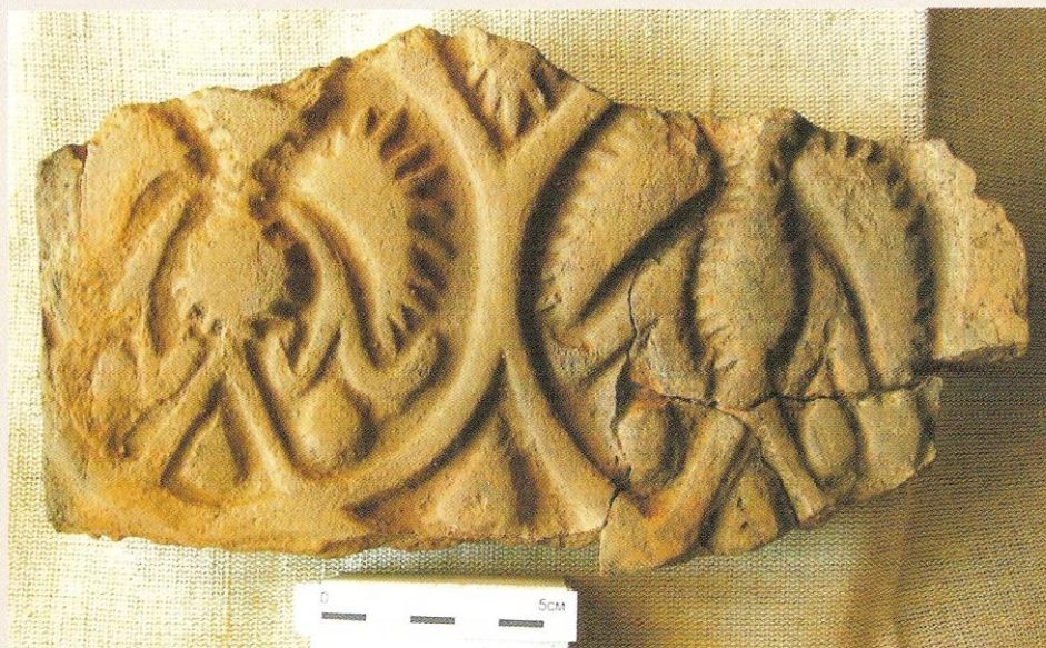
73. Фрагмент изразца. Обнаружен в 2005 году в г. Твери на территории бывшего Затъмацкого посада.