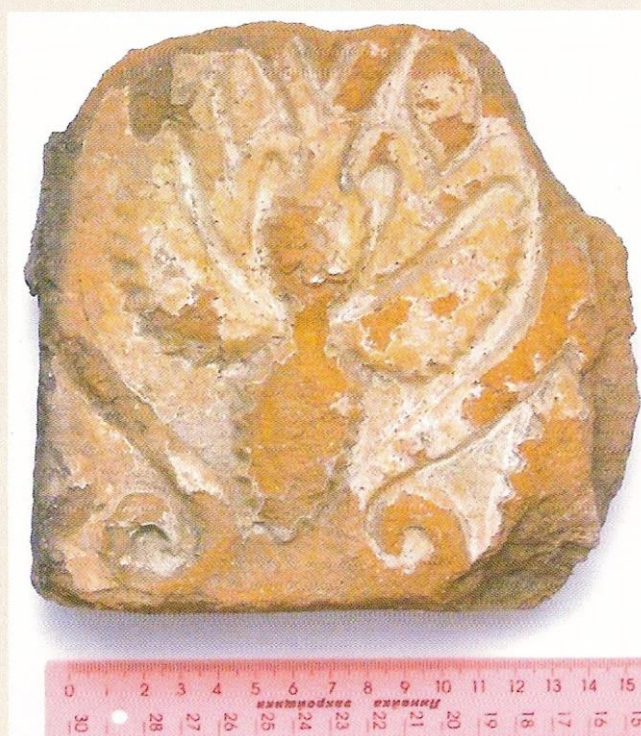
73. Фрагмент изразца. Обнаружен в 2005 году в г. Твери на территории бывшего Затъмацкого посада.