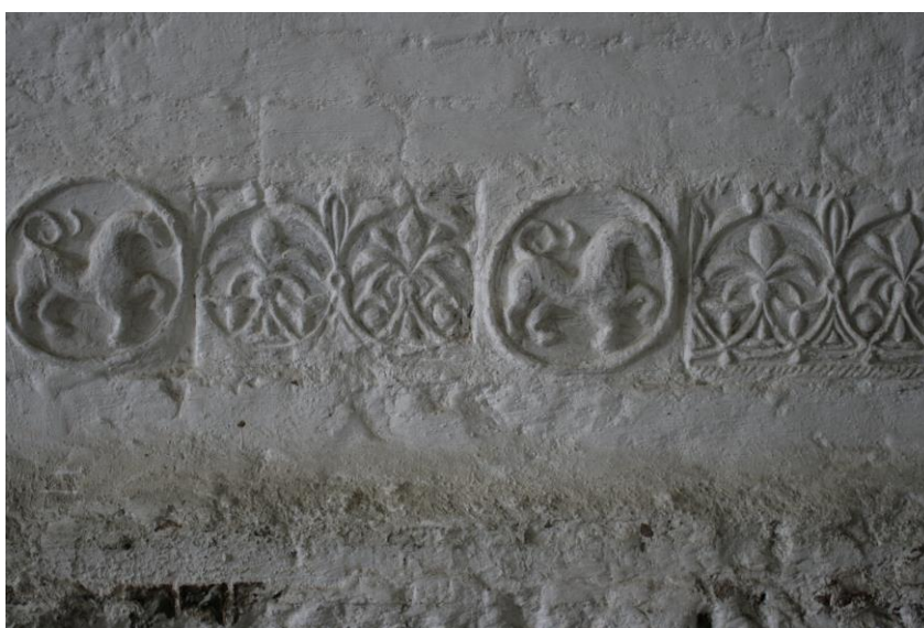
Декоративный пояс южной стены собора Рождества Богородицы. Справа – пример зубчиков.

Данные находки являются близкими аналогами терракотам, располагающимся вверху стен и на барабане собора Рождества Богородицы. «Тверские изразцы имеют близкий по типу двойной раппорт, состоящий из двух обрамленных растительными побегами пальметт. Вверху и внизу, на границе рельефного орнамента и плоских горизонтальных лент, на тверской терракоте фиксируются небольшие, по всей видимости, смазанные при формовке (при извлечении из формы) зубчики, близкие тем, что известны по терракотовым плитам