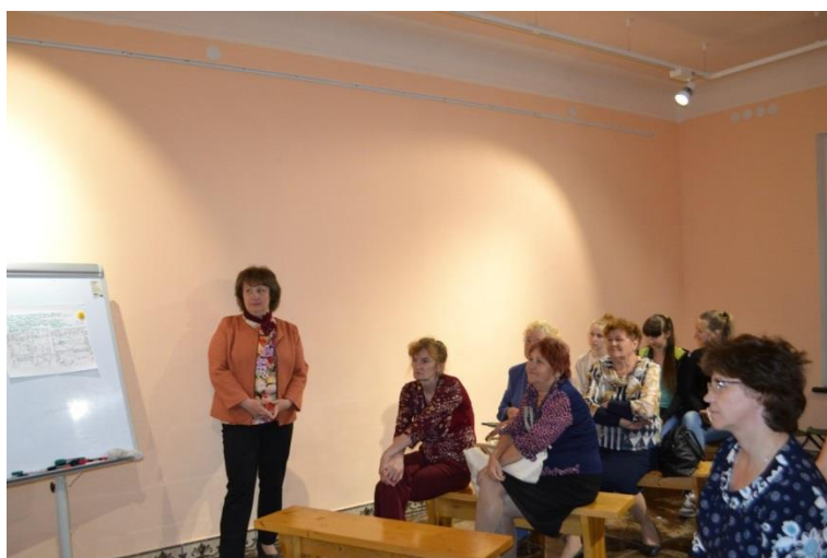
Фотография 3. Презентация проектов по благоустройству улицы Гостинодворской