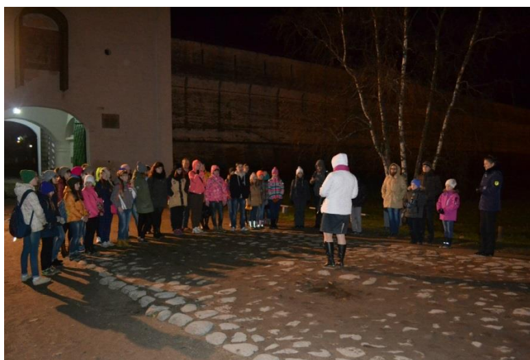
Фотография 2. Игра по городскому ориентированию

Проект «Это мой город» был представлен на областном конкурсе «Великие 40-е» и получил диплом молодежного парламента Вологодской области при Законодательном собрании Вологодской области за III место в номинации «Деятельность детских и молодежных общественных организаций по патриотическому воспитанию несовершеннолетних» (2015 год).