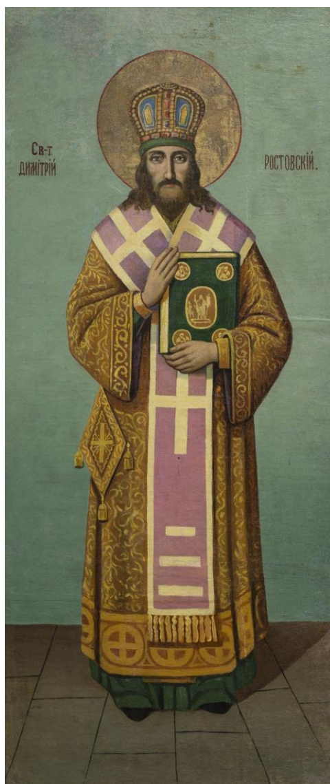
Фотография 6. Святитель Дмитрий Ростовский. МФД Ж-268

Долгие годы музей сотрудничает с Обществом друзей Музея фресок Дионисия. В 2015 году, благодаря этой организации, фонд старопечатных и рукописных книг пополнился экспонатами XIX века – две книги крюкового письма: «Ирмологий» и «Апокалипсис», которая украшена значительным количеством цветных иллюстраций, а также старопечатная книга кириллической печати «Размышление в день светлого Воскресения».