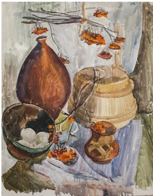
Фотография 4. Акварель «Натюрморт с рябиной». МФД ГР-1046