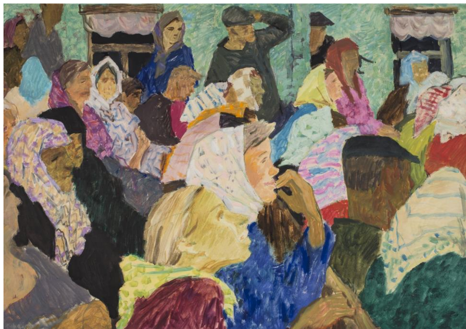
Фотография 1. Картина «Концерт в сельском клубе». МФД Ж-302.