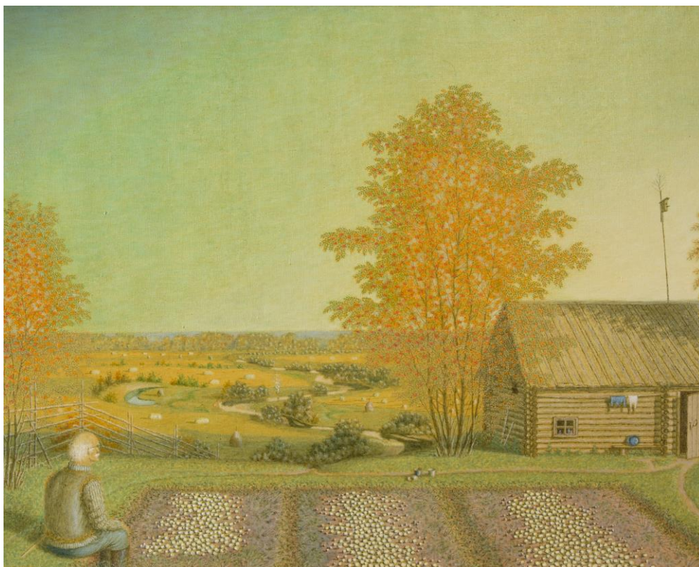
Фотография 2. Картина «Осеннее одиночество» МФД Ж-266

На картине изображен одинокий старик, сидящий на картофельной полосе, спиной к зрителю, смотрящий на плоды своего труда. В этом простом сюжете чувство осени жизни и ожидание расставания с этим прекрасным миром, где продолжают жить природа и труд человека.