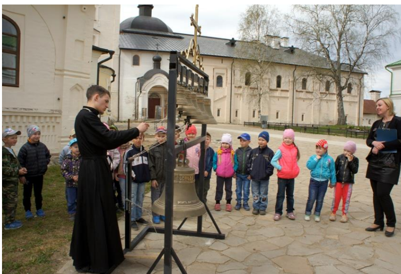
Фотография 2: Выездная звонница школы звонарей «Благовест» г. Череповца.