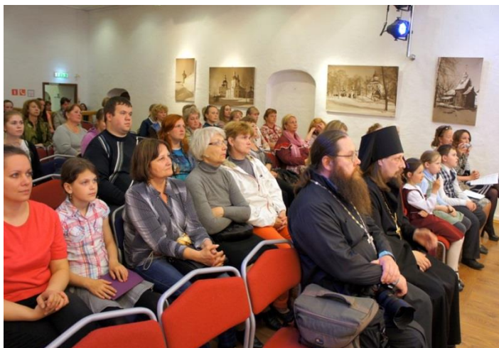
Фотография 7: Кирилловские зрители на благотворительном концерте «Кантилена».