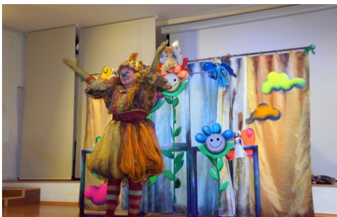
Фотография 3: Кукольный спектакль «Дюймовочка».

8 мая по доброй традиции в конференц-зале музея состоялся пасхальный утренник театральной студии «Сказ» при воскресной школе Кирилло-Белозерского мужского монастыря. Участники студии представили вниманию зрителей постановку «Девочка, наступившая на хлеб» (по мотивам сказки Г.Х. Андерсена). В концертной части пасхальной программы приняли участие гости из Череповецкой епархии, дети из воскресной школы Свято-Троицкого храма села Липин Бор Вашкинского района.