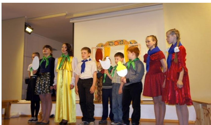
Фотография 4: На сцене дети из воскресной школы Свято-Троицкого храма с. Липин Бор.

8 мая по доброй традиции в конференц-зале музея состоялся пасхальный утренник театральной студии «Сказ» при воскресной школе Кирилло-Белозерского мужского монастыря. Участники студии представили вниманию зрителей постановку «Девочка, наступившая на хлеб» (по мотивам сказки Г.Х. Андерсена). В концертной части пасхальной программы приняли участие гости из Череповецкой епархии, дети из воскресной школы Свято-Троицкого храма села Липин Бор Вашкинского района.