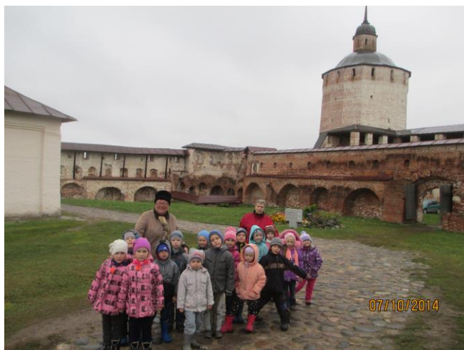
Фотография 1. Экскурсия «Архитектурный ансамбль Кирилло-Белозерского монастыря»