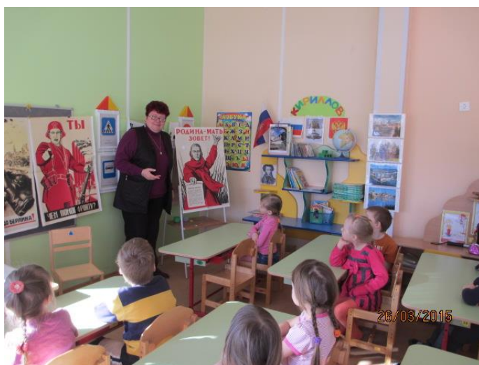
Фотография 4. «Художники о войне»

Работа с дошкольниками отличается многообразием методов и приемов.