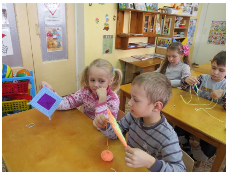
Фотография 3. Мастер-класс «Звезда- символ Солнца»

На занятиях и экскурсиях по теме «Народное искусство Белозерья» дети знакомятся с устройством русской избы – жилищем крестьянской семьи, с предметами старинного русского быта (печь, прялка, посуда, коромысло и т.д.), историей и особенностями русского народного костюма и его обязательного элемента – пояса, символическими значениями вышивки. Дошкольники учатся плести пояс, изготавливать солнечный символ. (Фотография 3)