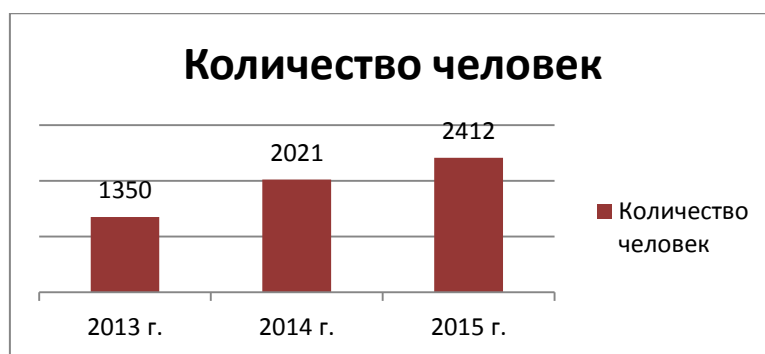
Рис.2 Количество человек, обслуженных по программе «Знакомьтесь, музей!» в 2013-2015 гг.

Реализация программы «Знакомьтесь, музей!» обеспечена методическими разработками занятий, видеофильмами, презентациями, материалами для мастер-классов, наглядными материалами и предметами.