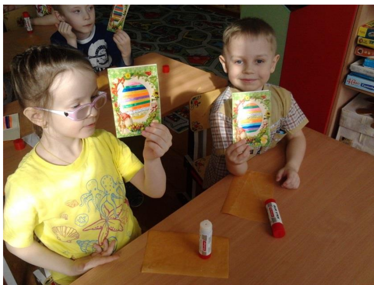
Фотография 2. Мастер-класс «Пасхальная открытка»

Приобщение ребенка к культуре своего народа – важное условие для патриотического воспитания, поскольку раскрытие личности в ребенке полностью возможно только через включение его в культуру собственного народа. Приобщение детей к отеческому наследию воспитывает в них уважение, гордость за землю, на которой живешь.