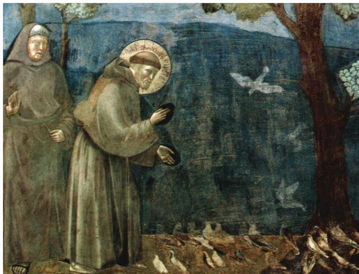
Франциск Ассизский проповедует птицам. 1297–1300. Джотто