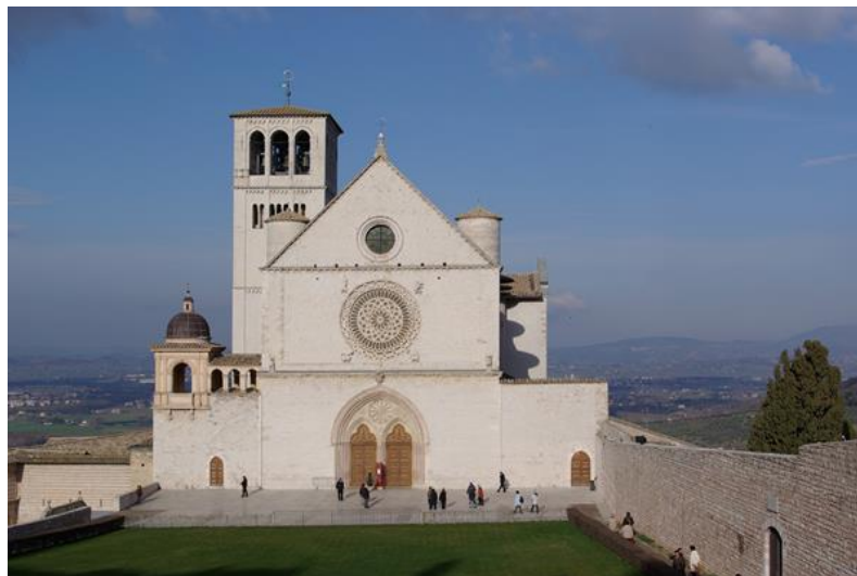
Базилика св. Франциска в Ассизи

–Расскажите о том, как вы узнали о Ферапонтовом монастыре и фресках Дионисия.