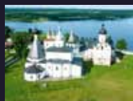
МУЗЕЙ ФРЕСКОК ДИОНИСИЯ