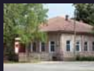
МУЗЕЙ ИСТОРИИ ГОРОДА И РАЙОНА