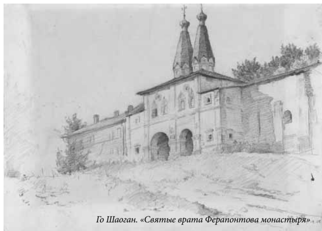
Го Шаоган. «Святые врата Ферапонтова монастыря»