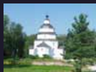
МУЗЕЙНЫЙ КОМПЛЕКС «ЦЫПИНО»