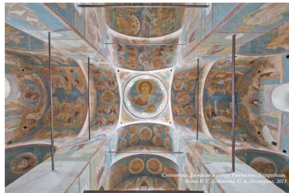
Стенопись Дионисия в соборе Рождества Богородицы.