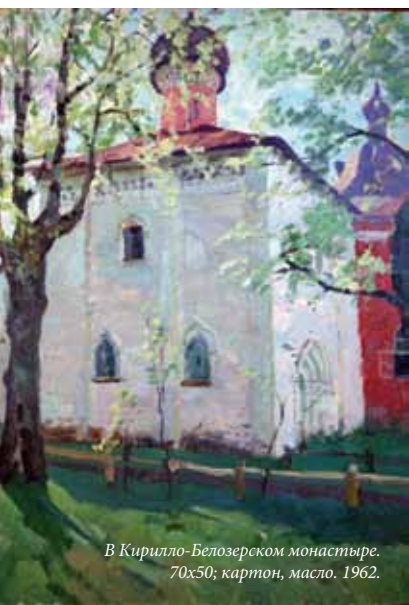
В Кирилло-Белозерском монастыре. 70х50; картон, масло. 1962.