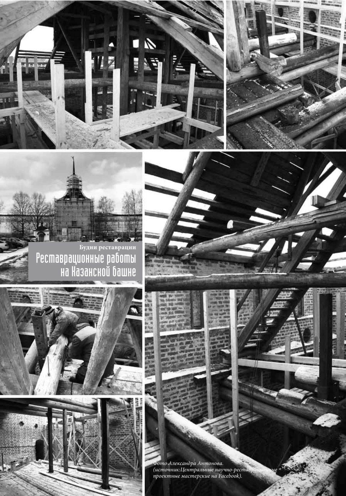
Будни реставрации Реставрационные работы на Казанской башне

За эту работу — «работу для людей» в музее отвечает отдел культурных мероприятий. С первых дней Год культуры для нашего отдела оказался счастливым. Тогда