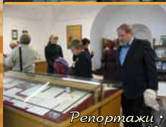
Репортажи • с.10