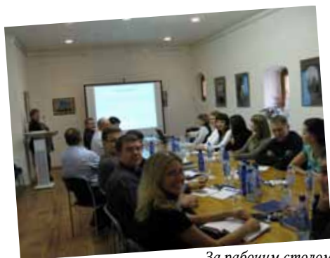
За рабочим столом сотрудники банка ВТБ-24

23–24 сентября в Ивановской области проходил первый сиваль сельских гостевых домов.