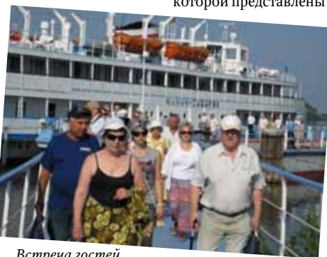
Встреча гостей с теплохода «Мамин-Сибиряк»

С 1 июня по 1 октября в Вологодской башне работала выставка «Ратная доблесть веков», на которой представлены