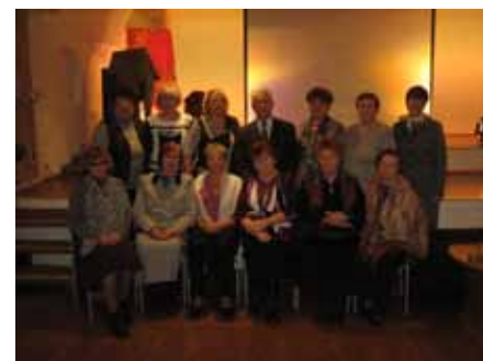
Участники вечера ветераны-музейщики

1 октября в музее прошли мероприятия, посвященные Дню пожилого человека. Ветераны-музейщики побывали на концерте кирилловского исполни-