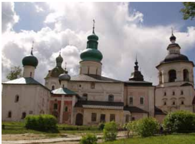
• Успенский Собор с папертями 1497г.

ной подготовкой дренирующего основания под них, что и воплощено в реальность в 2010 году. В основном объеме Успенского собора и в Западной пристройке воссоздан уровень и покрытия пола на период XIX века в виде имитации чугунных плит из керамогранита, размерами 60х60 см.