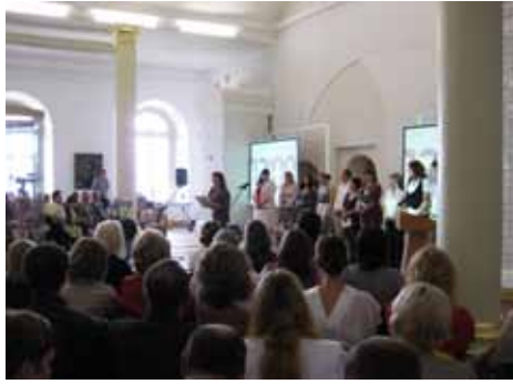
Рабочий момент конференции

тов конкурсов и премий фестиваля «Интермузей-2011». Наш музей стал победителем конкурса Министерства культуры РФ в номинации «Хранение как искусство» с проектом «Беспроводная система контроля температурно-влажностного режима собора Рождества Богородицы Ферапонтова монастыря» и получил первую премию в размере 250 тысяч рублей, а также памятный подарок – жемчужину, выполненную мастерами Гусевского хрустального завода.