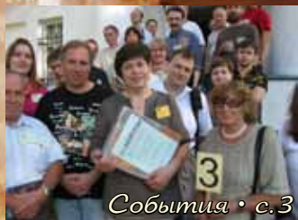
События • с.3