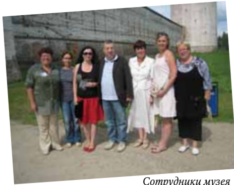
Сотрудники музея с Павлом Лунгиным

С 5 по 9 июля в Вологде проходил международный фестиваль молодого европейского кино «VOICES», его участники побывали на экскурсиях в Ферапонтово и Кириллово. Среди наших гостей были кинорежиссеры Павел Лунгин и Александр Сокуров, известная