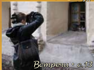
Встречи • с.13