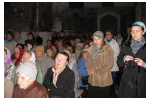
Встреча гостей с теплохода «Мамин-Сибиряк»