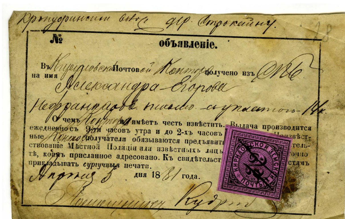
Извещение (объявление) о доставке почтой нефранкированного письма с уплатой 14 коп. от 5 апреля 1881г с маркой Кирилловской земской почты 1881 года