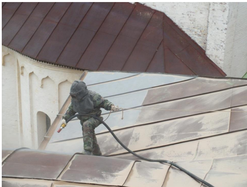
Фотография 6. Расчистка кровли от ржавчины и старой краски.

проекта С.Б. Куликовым и А.С. Куликовым подобрана краска фирмы «Курго Текнос» цвета «RAL 6025» (Фотография 5, 6).