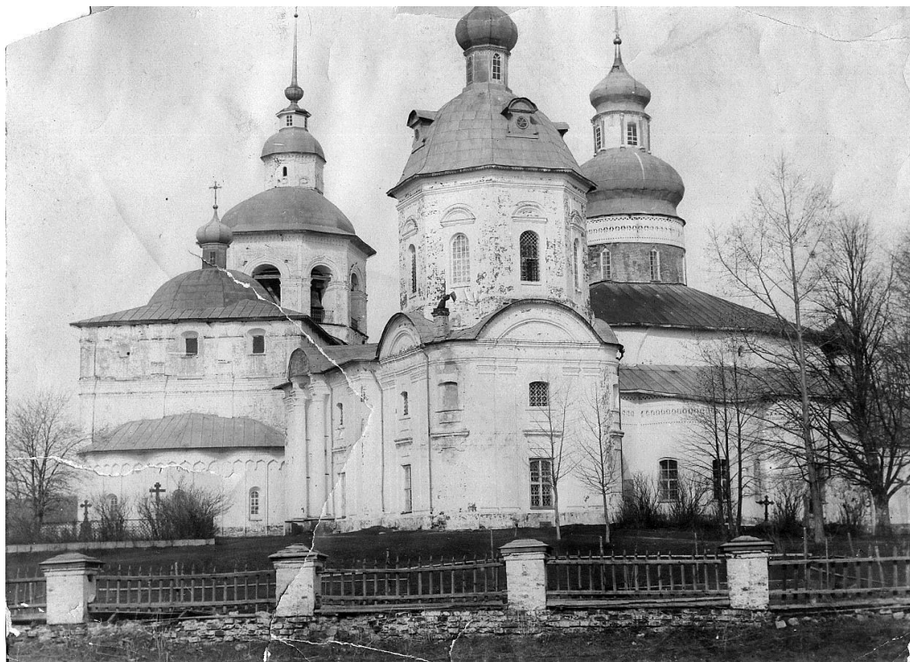
Фотография 4. Вид с юго-востока, начало XX века

В 2013 году ООО «Строительная культура» вычинялись (заменялся кирпич) трещины на фасадах, которые были вновь перекрашены, выполнены работы по расчистке и покраске кровли (фотографии 3,4). Стены окрашены качественной краской фирмы "Сарагол".