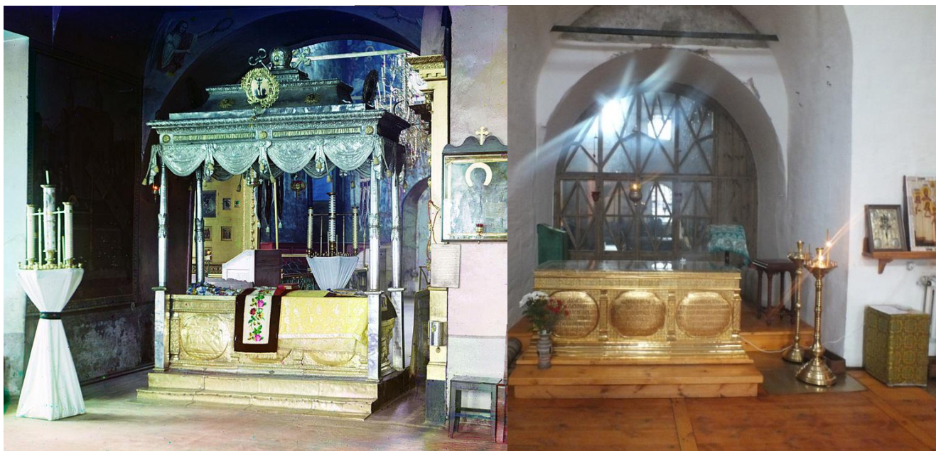
Фотография 1, 2. Утраченная сень над ракой преподобного Кирилла и обновленная рака после реставрации 2013 года

Памятник в целом хорошо сохранил свои архитектурные формы. Реставрационной пристройкой является западный притвор, сменивший деревянный тамбур начала XIX века. Деревянный потолок, делящий интерьер храма на два этажа, был разобран в процессе реставрационных работ 1994–1997 годов. Иконостас XVIII века перенесен из церкви преподобного Кирилла Белозерского в церковь Усекновения главы Иоанна Предтечи. Утрачена сень над ракой преподобного Кирилла, сама рака, как ценный памятник прикладного искусства находится в Оружейной палате в Москве (фото 1).