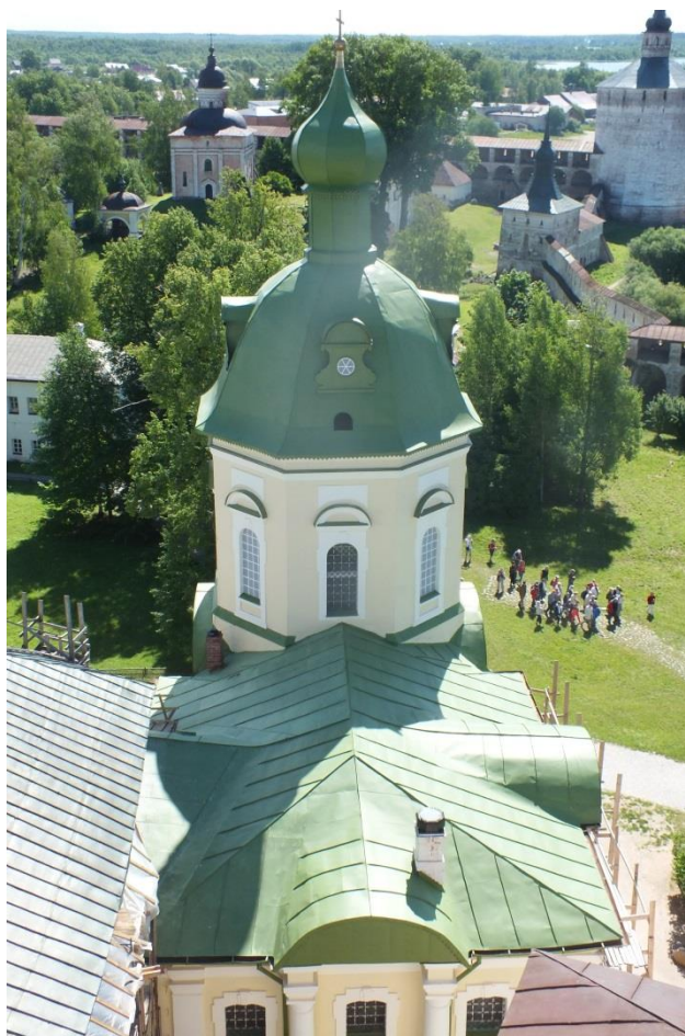
Фотография 7. Кровля после реставрации 2013 года