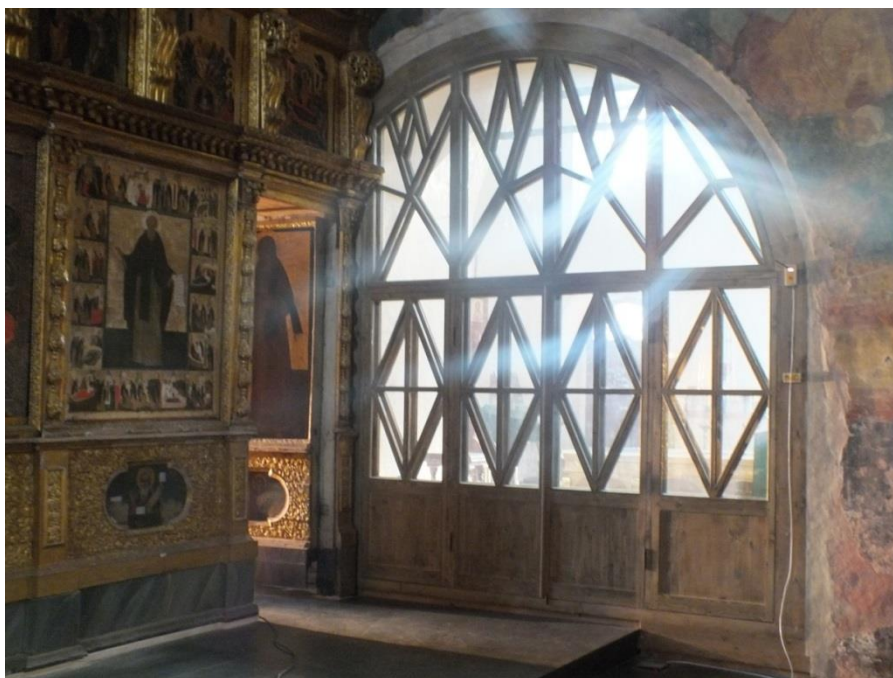
Фотография 3. Столярное заполнение арочного проема из церкви преподобного Кирилла Белозерского в Успенский собор

В 2011–2012 годах реставрационной компанией ООО «Электра» выполнен пристенный дренаж вокруг церкви с отводом дождевой и талой воды в песчаные слои на глубине три с половиной метра от дневной поверхности, воссоздано столярное заполнение арочного проема в Успенский собор, выполнено покрытие пола плиткой в арке (Фото 2).