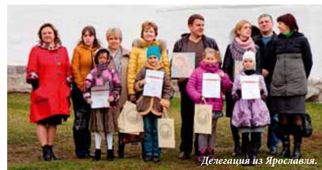
Делегация из Ярославля.

19 октября в Музее фресок Дионисия состоялась церемония награждения лауреатов российского конкурса «Архитектура средневековой Руси», целью которого, стало привлечение внимания детей к великому наследию древнерусских зодчих. Тема конкурса была выбрана не случайно. На протяжении многих веков средневековые постройки восхищают своей продуманной соразмерностью и строгой логикой архитектурного замысла. В нашей стране сохранились уникальные монастырские ансамбли и удивительные образцы храмовой архитектуры. Среди них комплексы Кирилло-Белозерского и Ферапонтова монастырей с соборами Рождества (1490) и Успения Пресвятой Богородицы (1497) – древнейшими каменными строениями на Русском Севере. Их популяризация также входила в задачу организаторов конкурса.