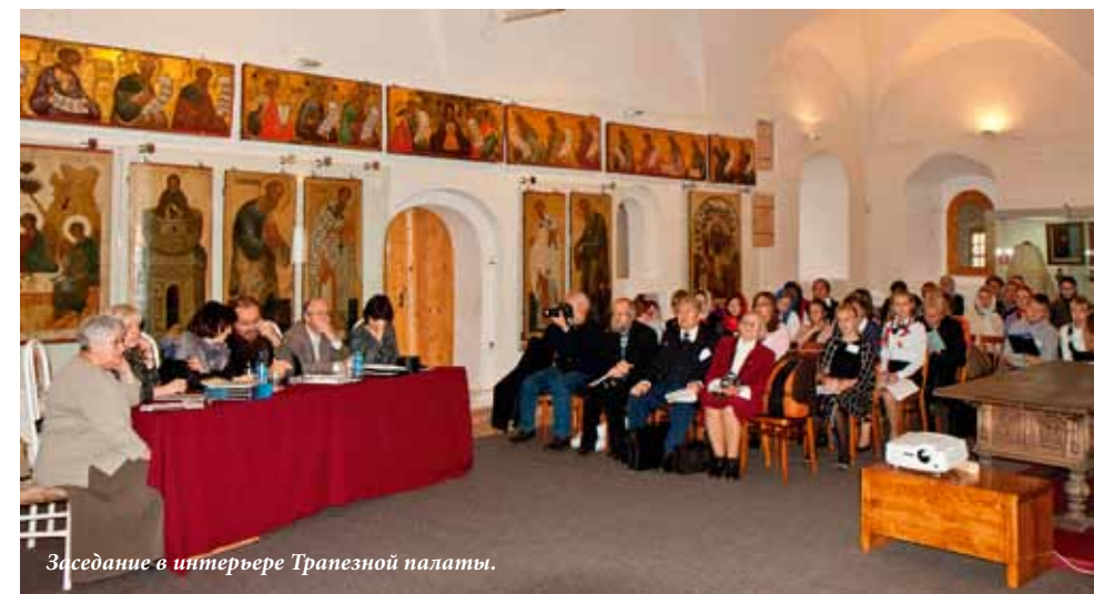
Заседание в интерьере Трапезной палаты.