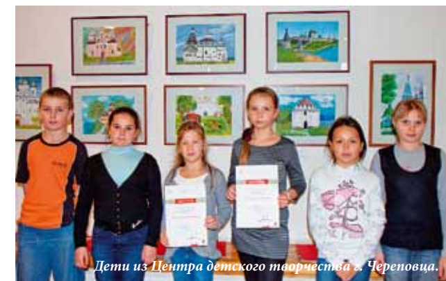
Дети из Центра детского творчества г. Череповца.

К участию были приглашены юные воспитанники детских художественных школ и школ искусств, художествен-