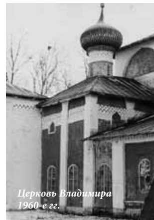
Церковь Владимира 1960-е гг.

26 октября 1612 года Второе ополчение освободило Москву от поляков. Однако с освобождением Москвы борьба с иностранными интервентами не закончилась. Отдельные отряды поляков и бывших тушинцев устремились на север страны с целью грабежа. Военные действия, развернувшиеся на Севере, потребовали от властей и населения осуществления ряда мероприятий. Уже в 1610 году