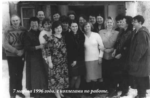
7 марта 1996 года, с коллегами по работе.

2007 год – Благодарственное письмо Управления по делам архивов Вологодской области.