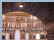
МУЗЕЙНЫЙ КОМПЛЕКС «ЦЫПИНО»