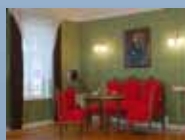
МУЗЕЙ ИСТОРИИ ГОРОДА И РАЙОНА

ЗАКАЗ ЭКСКУРСИЙ: 8 (81757) 314-79 www.kirmuseum.ru