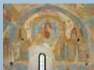
МУЗЕЙ ФРЕСК ДИОНИСИЯ