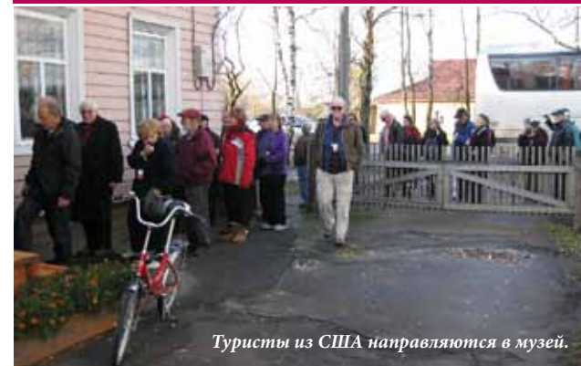
Туристы из США направляются в музей.