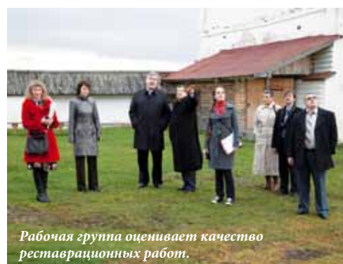
Рабочая группа оценивает качество реставрационных работ.