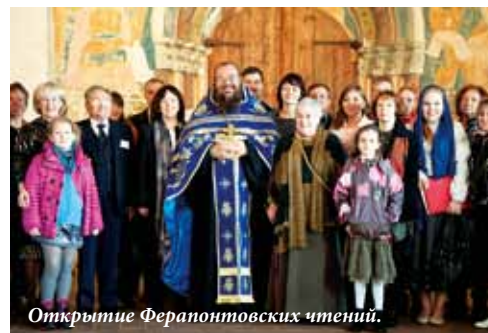
Открытие Ферапонтовских чтений.