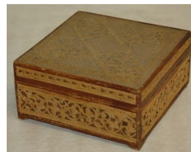
Фото 4. Шкатулка. Первая половина XX века.