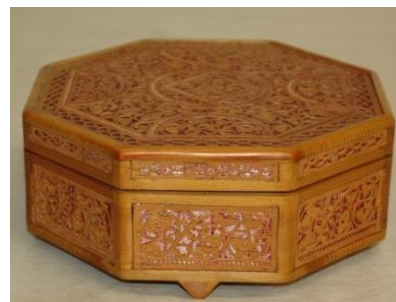
Фото 2. Шкатулка. 1956 год. Остроумов З.Г., Остроумова Л. В.

Первые шесть шкатулок были куплены в 1956 году; как известно из документов, предметы поступили из Шемогодской мебельной фабрики (Фото 2, 3). 1 В 1960 году одна шкатулка была подарена Калининой Лидией Ивановной (Фото 4). Следующим поступлением в 1991 году были две шкатулки, переданные через В.А. Мазалецкую. В