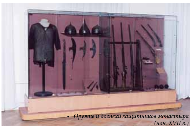
• Оружие и доспехи защитников монастыря (нач. XVII в.)