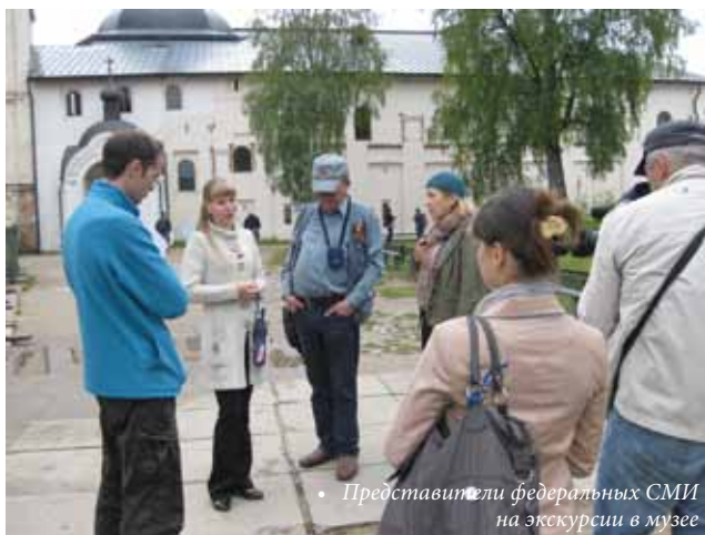
• Представители федеральных СМИ на экскурсии в музее