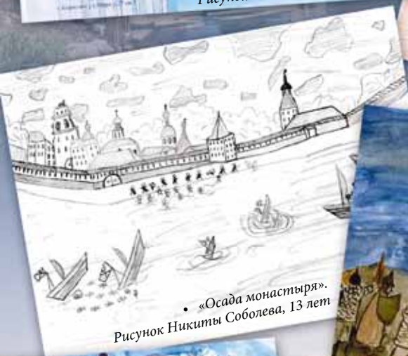
• «Осада монастыря». Рисунок Никиты Соболева, 13 лет