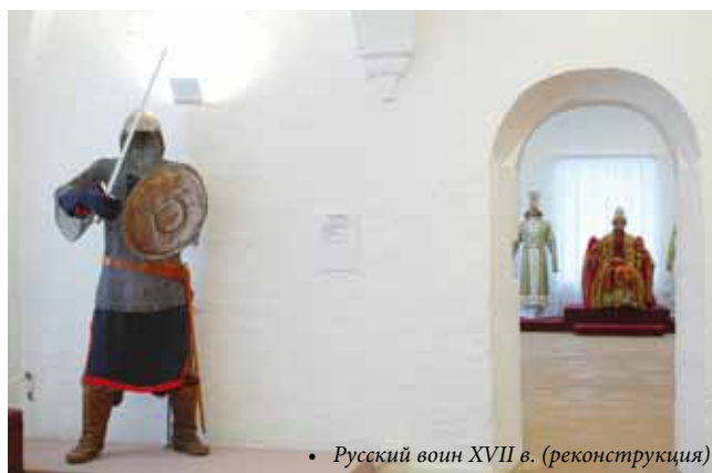
• Русский воин XVII в. (реконструкция)

надолго осталось в памяти поляков. «Ночью проплыли пять верст через небезопасные пороги, миновав язы – заграждения, которые на этой реке строят для ловли осетров. Говорят, что больших и лучших