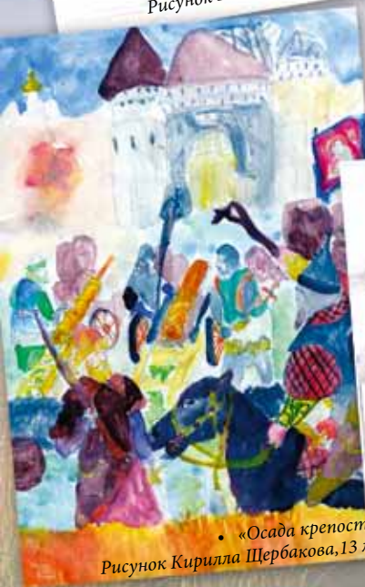
• «Осада крепости». Рисунок Кирилла Щербакова, 13 лет