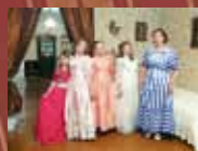
ФОТО В ИСТОРИЧЕСКИХ КОСТЮМАХ