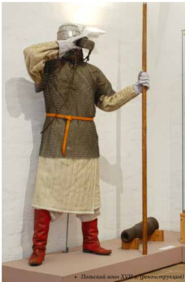
• Польский воин XVII в. (реконструкция)