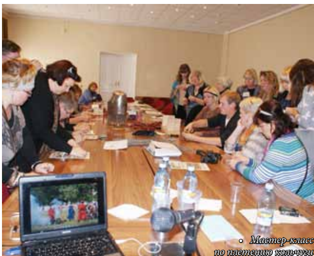
• Мастер-класс по плетению косички

Задача музеев – презентация истории во всех ее проявлениях. В Свияжске одна из экспозиций посвящена периоду репрессий и рассказывает о судьбах творческих людей, отбывавших заключение, но оставшихся внутренне сво-