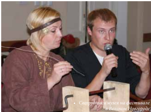
• Сотрудники музея на фестивале в Великом Новгороде

22 августа в Музее фресок Дионисия открылась выставка «Осень-2012». Это ежегодная экспозиция работ художников, живущих в летние месяцы в окрестностях Ферапонтова. Особенностью выставки является то, что вместе с мастерами выставляются их дети, а также начинающие художники. Всех авторов объединяет любовь к этим местам. Колорит и настроение работ определили концепцию выставки: «Утро, день, вечер, ночь». Работы разместились на восточной, южной, западной и северной стенах выставочного зала в соответствии с движением солнца.