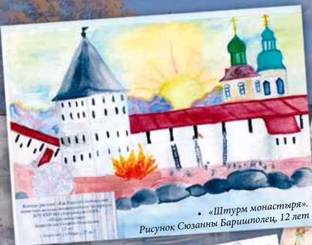
• «Штурм монастыря». Рисунок Сюзанны Баришполец, 12 лет