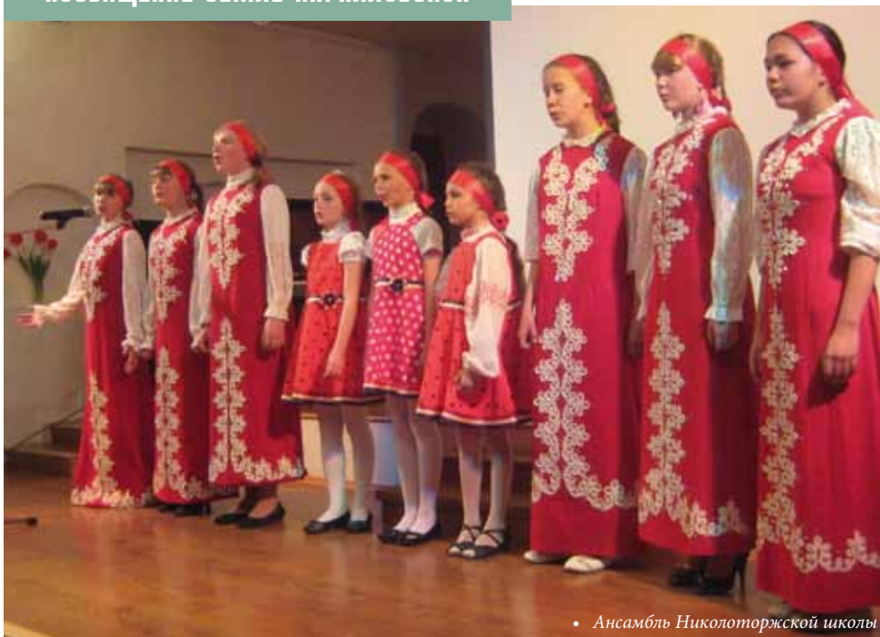
• Ансамбль Николоторжской школы