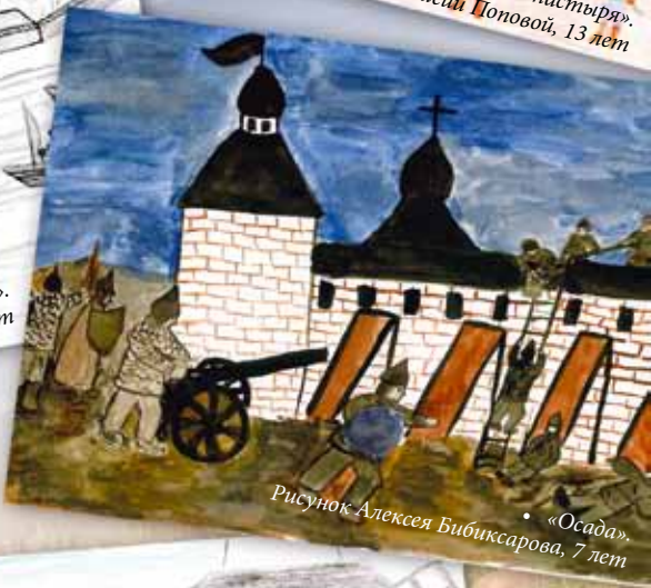
• «Осада». Рисунок Алексея Бибиксарова, 7 лет