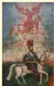
Иллюстрация реконструкция по мотивам русского лубка и народной картинки В. И. Новиков Отечественная война 1812 года Начало художественной студии «НОВИКЪ»

Караульные кельи Пресса работы: 9.00 - 18.00 Выходные дни: понедельник, вторник