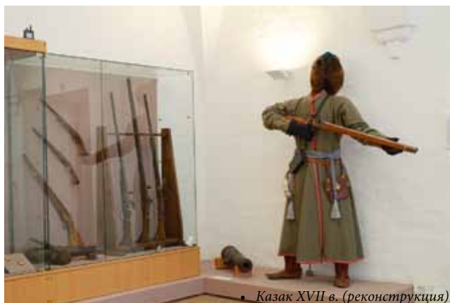
• Казак XVII в. (реконструкция)