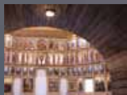
МУЗЕЙНЫЙ КОМПЛЕКС «ЦЫПИНО»