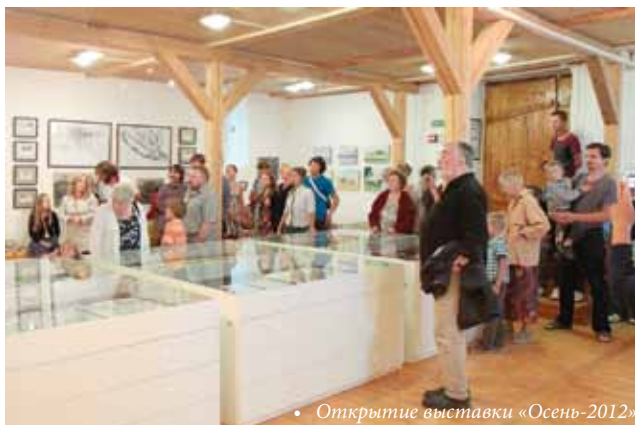
• Открытие выставки «Осень-2012»