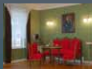
МУЗЕЙ ИСТОРИИ ГОРОДА И РАЙОНА

ЗАКАЗ ЭКСКУРСИЙ: 8 (81757) 314-79 www.kirmuseum.ru