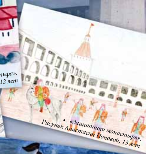
• «Защитники монастыря». Рисунок Анастасии Поповой, 13 лет