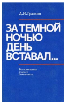
Фотография 7. Книга Д.И. Гразкина

Дмитрий Иванович Гразкин родился 22 октября 1891 года в деревне Великий Двор Зауломской волости Кирилловского уезда. Еще рабочим-подростком он