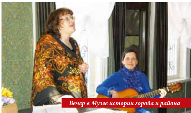
Вечер в Музее истории города и района