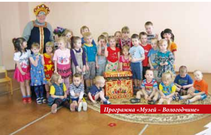
Программа «Музей – Вологодчине»

В Московском Кремле открылась выставка «Великий князь и государь всея Руси Иван III». Личность этого правителя, как и его вклад в развитие России все еще недооценены потомками: именно в его правление было свергнуто многовековое ордынское иго и завершился процесс объединения разрозненных русских земель в единое государство. Около ста уникальных экспонатов представлены вниманию широкой публики с 20 марта по 14 июля 2013 года. Среди них – две иконы из собрания Кирилло-Белозерского музея-заповедника: храмовая икона из иконостаса церкви Ризоположения села Бородава «Положение пояса и ризы Богородицы во Влахернском храме в Константинополе» (ок. 1485 г.) и икона «Богоматерь Знамение, пророки Давид и Соломон» (ок. 1502 г., Москва) из пророческого ряда иконостаса собора Рождества Богородицы Ферапонтова монастыря.