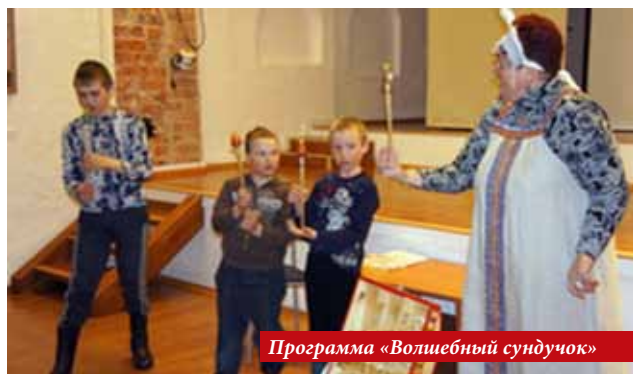
Программа «Волшебный сундучок»