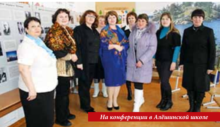
На конференции в Алёшинской школе