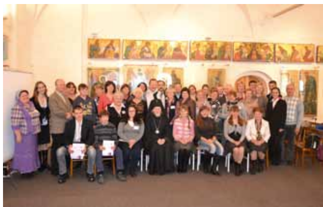
• Участники Чтений с архиепископом Вологодским и Великоустюжским Максимилианом

лега предложила поучаствовать, и мы с учениками «заразались» Чтениями. Каждый год с большим удовольствием приезжаем на эти встречи и заметили, что число участников ежегодно растет. Очень нравится общаться с коллегами и ребятами из разных школ района и других городов: узнаешь много нового и интересного, так как тематика докладов разнообразна...»