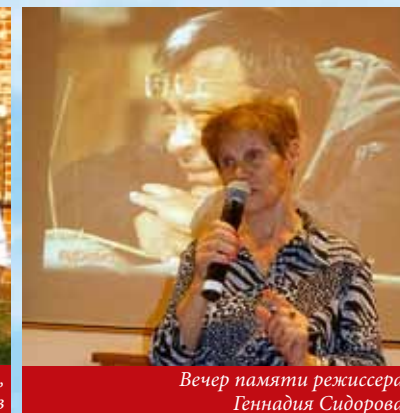
Вечер памяти режиссера Геннадия Сидорова