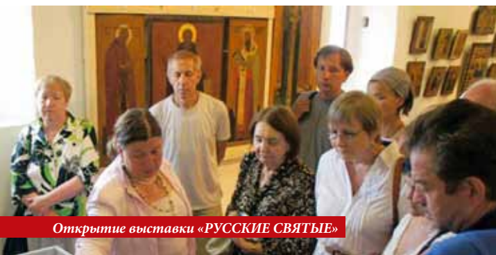
Открытие выставки «РУССКИЕ СВЯТЫЕ»