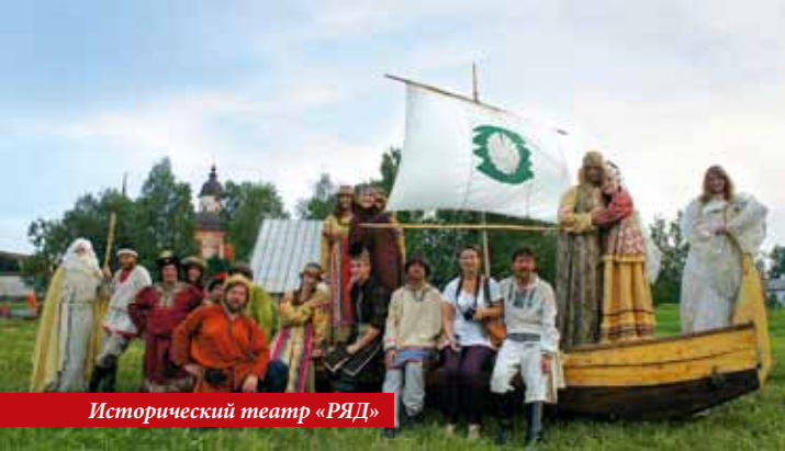
Исторический театр «РЯД»