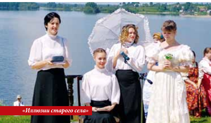
«Иллюзии старого села»