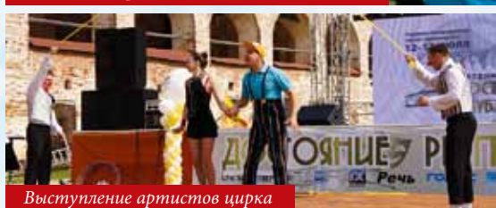
Выступление артистов цирка