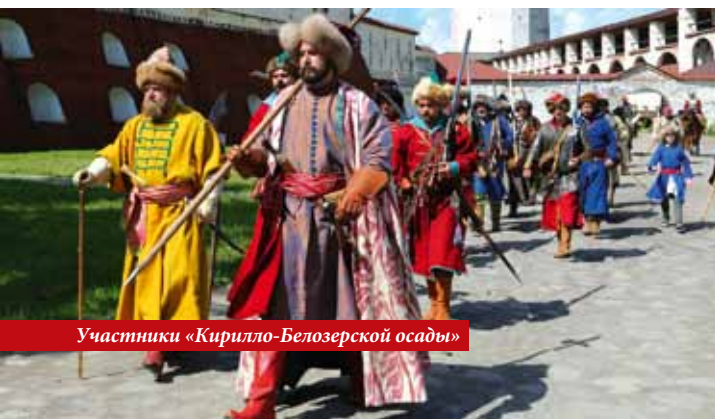
Участники «Кирилло-Белозерской осады»

шими гостями были: Стефан Лаудин – директор Варшавского международного кинофестиваля; Бела Тарр – мастер венгерского авторского кино; итальянская актриса Оливия Маньяни, сыгравшая главную роль в фильме Паоло Соррентино «Последствия любви»; Эрик Эбони – известный французский киноактер африканского происхождения, игравший в таких фильмах, как «Царство небесное» (2005), «Поездчик 3» (2008), «Черное золото» (2011).