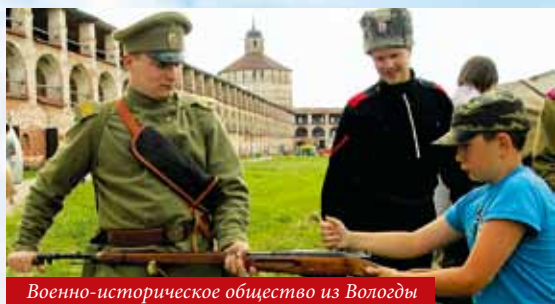
Военно-историческое общество из Вологды