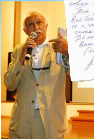
Народный артист России режиссер Н.Н. Досталь

Терпеть не могу - и сейчас сейчас не бегу! Ты же знаешь! Всё было сказано, игра и, что она была - игра. Спасибо! До новых встреч на вашем прекрасном (сценарии). Н. Досталь 13.07.2013.