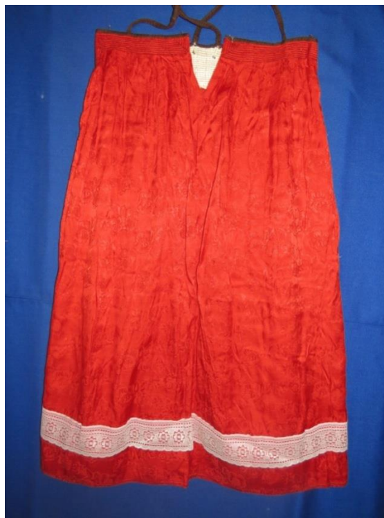
САРАФАН. 50-е годы XX века. КП 21462 НТ 2668

Украшались сарафаны из тканей фабричного производства и вышивкой. Тамбурная строчка – ряд петель, выходящих одна из другой. С изнаночной стороны шов выглядит, как машинная прямая строчка. Узоры вышивки тамбурным швом имеют