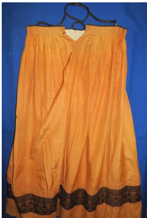
САРАФАН. 40-е годы XX века. КП 21299 НТ 2580

В коллекции музея сарафанов, сшитых из ткани фабричного производства, насчитывается пятнадцать, не считая шелковых. Это праздничные, нарядные сарафаны «на выход». Названия свои они часто получают от названия ткани: «штофник», «гарусник», «гарнитурник», «кашемирник». Все сарафаны датируются 30-ми годами XX века. Сшиты на швейной машинке, с фрагментами ручной обработки швов. На большинстве сарафанов для отделки используется широкое кружево фабричного производства из капроновой нити, которое пришито исключительно за верхний край, чтобы избежать деформации при усадке основного полотна.