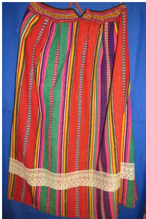
САРАФАН. Начало XX века. КП 12942 НТ 2253

При раскрое полосы узора располагались сверху вниз. Отсюда и название сарафанов такой расцветки – «дольники», «доловики», т.е. расположенные «вдоль» стана. Бытовали сарафаны «дольники» или «доловики» в Вологодской области в первой трети