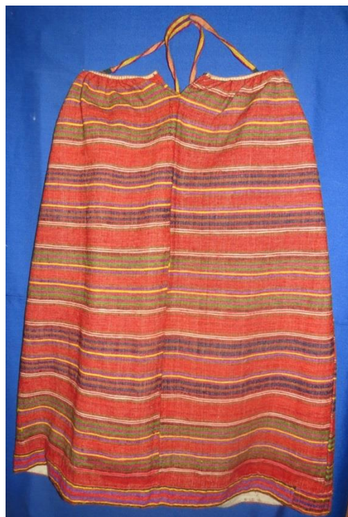
САРАФАН. Начало XX века. КП 8082 НТ 1826

Пошив сарафанов «доловиков», в общих чертах, аналогичен пошиву пестрядинных сарафанов. Под обтачку верхнего среза закладываются мелкие складочки излишков ткани. Застежка спереди на металлические крючок и петлю. Также по низу подола пришивалась широкая полоска холста – «пыльник» для укрепления подола. На сарафанах «доловиках» отсутствует «лягушка» – декоративная цельнокроеная деталь, к которой на спинке пришиваются лямки. На пестрядинных сарафанах «лягушка» встречается чаще.