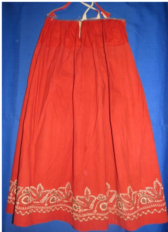
САРАФАН. Начало XX века

Лямки узкие, пришивные из рулика или тесьмы фабричного производства.