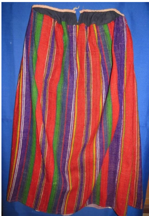
САРАФАН. Начало XX века. КП 9264 НТ 1890

В коллекции Кирилло-Белозерского музея-заповедника хранятся девять сарафанов из домотканой шерстяной материи. Полихромный узор получался за счет чередования полос разной ширины и цвета. Преобладал красный цвет. Привязанность к сочным, ярким краскам имеет символическое значение, уходящее корнями в дохристианские времена. Широкие красные полосы часто чередуются с насыщенно-фиолетовыми и зелеными. Для разделки широких полос использовали нити желтого, коричневого, черного цветов, но такие полоски узкие и их меньше в узоре.