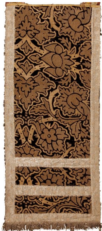
Набедренник. XVII век.

Кирилло-Белозерский музей обладает великолепными произведениями орнаментального золотного шитья. Это еще один способ украшения церковных тканей и богослужебных облачений. Иногда орнаментальное шитье имитировало драгоценные привозные ткани настолько искусно, что без изучения изнаночной стороны трудно отличить ткань от вышивки. В музейном собрании сохранились вещи, украшенные подобным образом. Узор вышивок на них, выполненный золотными нитями плоскостным швом «в прикреп», подражает растительным орнаментам привозного художественного текстиля XVII–XVIII веков. Использование в орнаментальных вышивках золотных нитей придает праздничным церковным облачениям особую парадность и торжественность.