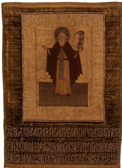
Пелена «Кирилл Белозерский». 1598 год.

изысканных произведений знаменитой мастерской. На пелене – поясное изображение Христа с короной на голове. Тонкие черты удлинённого лица, обрамленного пышными волосами и небольшой бородкой, отличаются благородством. Роскошные одежды шиты золотными и серебряными нитями с яркими цветными прикрепами. Мастерицы блестяще исполнили сложнейшие узоры.