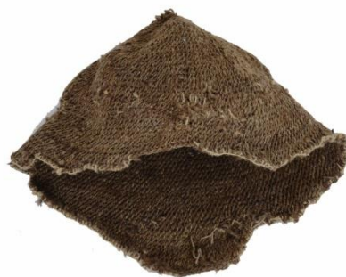
Колпачек (клобук) Преподобного Кирилла. Конец XIV – первая четверть XV века.

Самыми ранними экспонатами являются вещи и одежды, принадлежавшие, по преданию, основателям Кирилло-Белозерского и Ферапонтова монастырей, Нило-Сорской пустыни. Эти святыни были переданы музею в 1920-е годы, после закрытия монастырей и церквей. В музее хранятся фелонь, стихарь, шуба, колпачек (клобук) и кожаный пояс с калитой Преподобного Кирилла Белозерского, фелонь и стихарь Преподобного Мартиниана, власяница и четки из верблюжьей шерсти Преподобного Нила Сорского. Они имеют исключительную историческую ценность, как мемориальное свидетельство повседневной жизни великих подвижников.