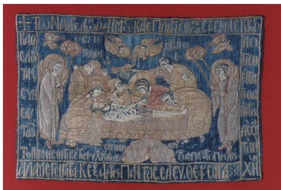
Плащаница «Положение во гроб». Конец XV – начала XVI века.

Одним из самых ранних памятников лицевого шитья в собрании музея считается малая напрестольная плащаница «Положение во гроб» конца XV – начала XVI века. В ее среднике вышита вкладная надпись на греческом языке. Стилистические особенности шитья указывают на молдавское происхождение плащаницы.