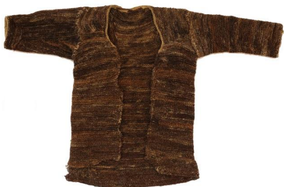
Власяница Нила Сорского. XV век.

Редчайшие мемориальные памятники, связанные с именем Преподобного Нила Сорского – власяница и четки. Власяница надевалась прямо на голое тело для смирения плоти. В XIX – начале XX века она хранилась в Тихвинском соборе основанной святым пустыни, около раки преподобного, в особом футляре за стеклом. Во время молебнов преподобному Нилу ее надевали на больных ради исцеления. Рядом с власяницей хранились и четки. Они напоминают вервицу (веревку с узлами) – древнейший вид четок.