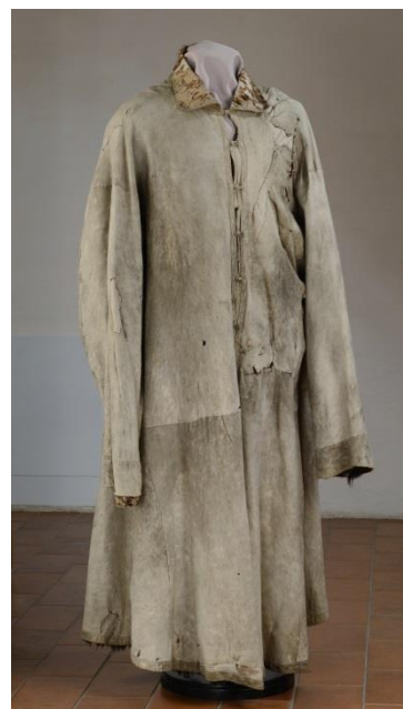
Шуба Преподобного Кирилла. Конец XIV – первая четверть XV века.

В ризнице Ферапонтова монастыря, согласно описям имущества, находились подризник и фелонь Маритиниана. Они были переданы в Кирилло-Белозерский музей после закрытия монастыря и сохранились до нашего времени.