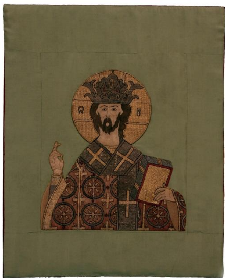
Пелена «Спас Великий Архиерей». 1565 год.

В музее хранится покров на раку преподобного Кирилла Белозерского, связанный с именем инокини Марфы (царицы Марии Федоровны Нагой, последней жены Ивана IV Грозного). В монастырь он был вложен после смерти царевича Дмитрия, очевидно, в годовщину его гибели, в 1592 году. Сохранилась вкладная надпись в две строки, свидетельствующая, что он был вышит в 1587 году. Покров выполнен шелковыми нитями «в прикреп», лик – «по форме», нимб шит золотом. Возможно, его вышивала сама царица.