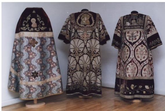
Облачения священнослужителей. XIX век.

По своему интересны поздние произведения, которые составляют значительную часть коллекции. В предметах XVIII–XIX веков практически отсутствуют композиции с шитыми ликами, за редким исключением, они выполняются в технике масляной живописи, шитьем по карте (картону). Очень популярной в XIX веке становится аппликация. Широко