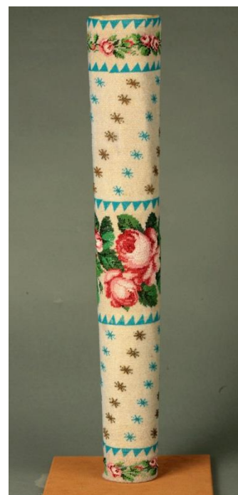
Объемник для свечи. XIX век.

В музее хранится небольшая, но очень интересная коллекция предметов шитья, украшенных «фальшивым жемчугом», то есть бисером. Среди них – покровцы, ленты к лампадам, шнуры (жгуты), на которых носили иконки и образки. Многие предметы из коллекции музея происходят из Горицкого Воскресенского женского монастыря, славившегося своими рукодельницами. Особое внимание обращают на себя подставки (объемники) для свечей из коллекции музея, датируемые XIX веком: массивные, высокие, одетые в бисерные чехлы, они вставлялись в большие церковные подсвечники, а на них уже ставилась свеча или лампада. На этих бисерных чехлах расцветает целый сад великолепных гирлянд. Применение в XIX веке мелкого бисера разнообразнейших сортов и оттенков позволяло мастерицам подбирать для шитья богатую красочную палитру и с большим мастерством передавать узоры орнамента и композиционные построения. Поверхность вышивки могла быть полностью покрыта бисером так, что создавалась иллюзия полностью стеклянной вещи. Так выглядят некоторые покровцы из коллекции музея. Бисерные изделия, хранящиеся в музее, еще мало изучены и практически нигде не опубликованы.