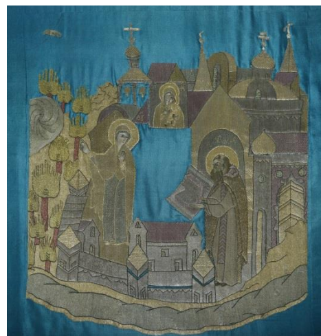
Пелена «Явление Богоматери Кириллу Белозерскому». 1620–1635 годы.

В монастырских переписных книгах 1635 года упоминается еще одно произведение шитья: «пелена выносная, камка таусиная, на ней шито видение чудотворца Кирилла, как видел Пречистую Богородицу». Речь идет о пелене «Явление Богоматери Кириллу Белозерскому», которая была исполнена в 1620–1635 годах в придворном Вознесенском монастыре Московского Кремля в светлице царицы-инокини Марфы (Марии Ивановны Романовой, матери царя Михаила Федоровича). В монастырь пелена была вложена членами богатой боярской семьи Сулешевых. Столичное