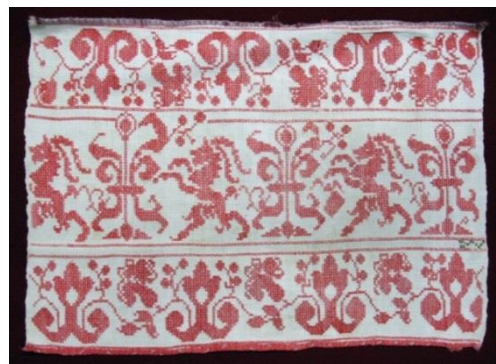
Проставка к полотенцу. Конец 1890-х годов.

губернии. Вышивка – один из самых распространенных способов женского рукоделия в конце XIX – начале XX века. Ею украшали женские и мужские рубахи, передники, скатерти-«столешники», подзоры простыней, полотенца, проставки и концы к полотенцам. Вышивка отличалась разнообразием технических приемов исполнения: использовался двусторонний шов, крест, шов по выдергу, по вырези, роспись, вологодское стекло, тамбур, гладь. Богат и разнообразен сюжетный строй вышивки, сохранивший древние мотивы и образы.