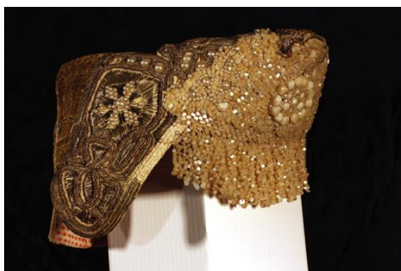
Кокошник. XIX – начало XX века

К праздничным головным уборам относят кокошники. Они были очень разнообразны