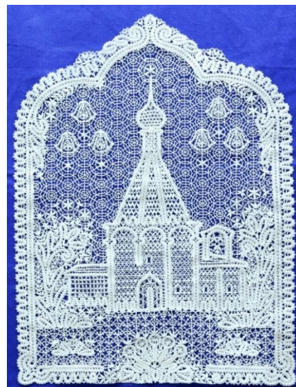
Панно «Северный звон». 2010 год.

Большая научная значимость хранящейся в музее информации привела к необходимости систематизации коллекции и издания каталога. Это позволит ввести в научный оборот и сделать общедоступным предметы народного искусства.