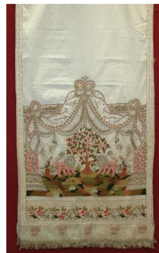
Полотенце. Конец XVIII – начало XIX века.

В 1924 году из закрывавшихся в Кирилловском уезде приходских и монастырских храмов, наряду с церковной утварью, различными тканями, поступили декорированные вышивкой полотенца. Одно из самых ранних полотенец в собрании происходит из Горицкого Воскресенского женского монастыря и датируется концом XVIII – началом XIX века. Обширная коллекция полотенец XIX – начала XX века с вышивкой, браными проставками, с надписями и печатью, бытовавших в крестьянской и