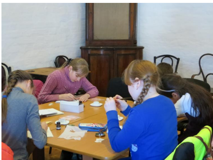
Фотография 3. Наполнение пера тушью

На одном из занятий для разминки пальцев я попросила детей медленно, красиво и без ошибок написать слово «Каллиграфия» привычным для них инструментом (шариковой ручкой) и привычным почерком. Выполняя это задание, дети очень старались. Но раз за разом они повторяли одни и те же графические ошибки. Буквы «плясали»: они не доставали до верхней и нижней линеек, имели разный наклон и ширину. Так выяснилось, что начинать нужно с самых азов. За хороший почерк отвечает целый ряд факторов. Из них два первоочередных – это развитая мелкая моторика руки и развитые пространственные представления. Мелкая моторика отвечает за ритмичность, плавность и точность движений, а пространственные представления – за понимание строения букв, которые пишешь. К сожалению, сегодня у многих детей и даже взрослых мелкая моторика развита не в должной степени, а осознанное понимание строения букв практически отсутствует.