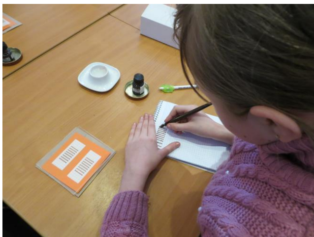
Фотография 2. Правильная постановка пальцев руки

На одном из занятий для разминки пальцев я попросила детей медленно, красиво и без ошибок написать слово «Каллиграфия» привычным для них инструментом (шариковой ручкой) и привычным почерком. Выполняя это задание, дети очень старались. Но раз за разом они повторяли одни и те же графические ошибки. Буквы «плясали»: они не доставали до верхней и нижней линеек, имели разный наклон и ширину. Так выяснилось, что начинать нужно с самых азов. За хороший почерк отвечает целый ряд факторов. Из них два первоочередных – это развитая мелкая моторика руки и развитые пространственные представления. Мелкая моторика отвечает за ритмичность, плавность и точность движений, а пространственные представления – за понимание строения букв, которые пишешь. К сожалению, сегодня у многих детей и даже взрослых мелкая моторика развита не в должной степени, а осознанное понимание строения букв практически отсутствует.