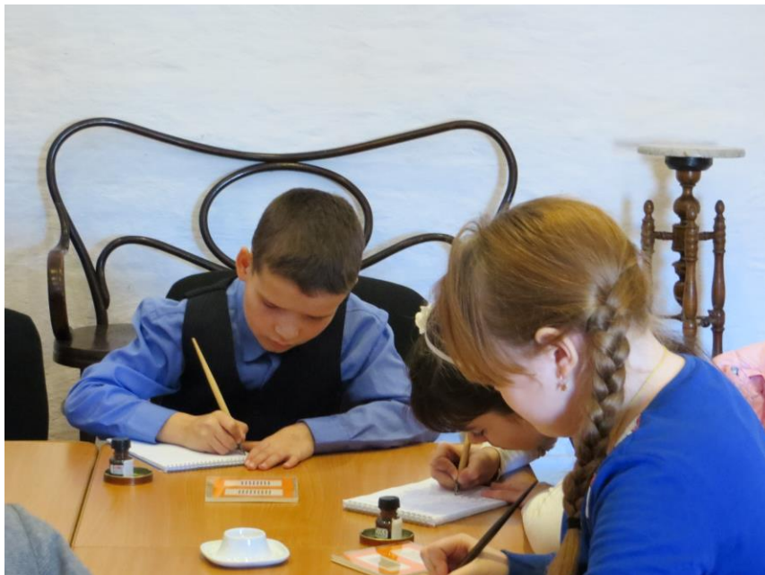
Фотография 1. Занятие по каллиграфии

школы (14–16 лет). Дети, посещающие Воскресную школу (10–13 лет), изучают древнерусское декоративное письмо вязь, в котором строка связана в непрерывный декоративный орнамент заголовка.