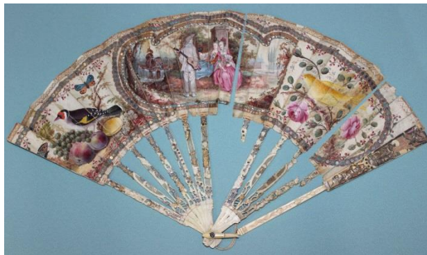
Фото 2. фрукты и ягоды: персики, виноград, абрикос и кисть смородины. Справа от центральной сцены – птица, сидящая на цветущей розовой ветви. Экран веера украшен блестками, а костяные пластины – цветными точками и сквозной ажурной резьбой с изображениями амуров, кавалеров, цветочных гирлянд.

Один веер (фото 2), поступивший в коллекцию музея-заповедника, привлекает внимание. На нем изображена живописная галантная сцена в медальоне: две дамы в сквере и кавалер с музыкальным инструментом перед ними. У одной дамы в руке маска, у другой – веер. Рядом с ними – фонтан в виде огромной рыбы с ниспадающей из него водой. Слева от медальона изображена птица, две бабочки и