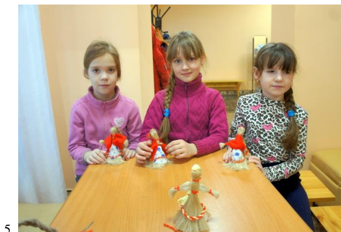
Фотографии 4,5: мастер-класс «Кукла из льна»

4 Января в Музее истории города и района было шумно и весело. Ребята со своими мамами, папами, бабушками и друзьями стали свидетелями новогоднего представления. Вниманию зрителей были представлены кукольный спектакль «Филькина ёлка» и мастер-класс «Ёлка-пúтанка». В начале представления дети оказались участниками интерактивного действия: волшебница Метелица, героиня кукольного спектакля,