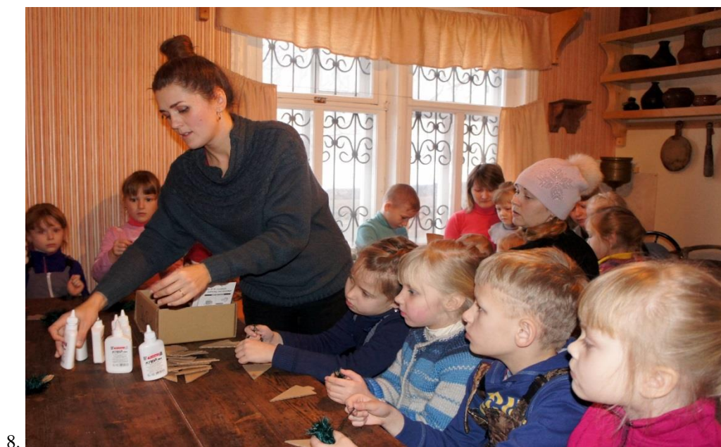
Фотография 8: мастер-класс «Ёлка-пúтанка»

По окончании спектакля зрители проследовали в следующий зал музея. Ребята и взрослые стали участниками мастер-класса «Ёлка-пúтанка», где изготовили новогоднюю игрушку-сувенир. Заготовками для будущего ёлочного украшения послужили шаблоны из картона, материалами – пушистые нити, клей ПВА, пенопласт.