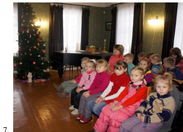
Фотографии 6,7: Кукольный спектакль «Филькина ёлка»

По окончании спектакля зрители проследовали в следующий зал музея. Ребята и взрослые стали участниками мастер-класса «Ёлка-пúтанка», где изготовили новогоднюю игрушку-сувенир. Заготовками для будущего ёлочного украшения послужили шаблоны из картона, материалами – пушистые нити, клей ПВА, пенопласт.