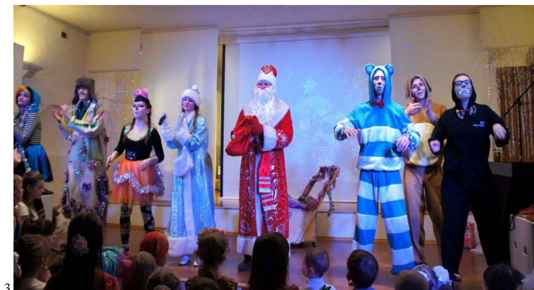
Фотографии 1, 2, 3: Новогоднее представление «Трое из Простоквашино»

Один из ведущих принципов проекта «Новогодние каникулы в музее» – интерактивность, так как человек воспринимает только то, что делает, в чем непосредственно участвует сам. Именно поэтому сотрудниками музея были подготовлены