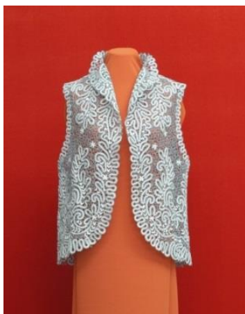
Блуза Н.В. Веселова 2007

Мода на кружевные изделия была всегда и остается до сих пор, поэтому кружевная одежда и кружевные аксессуары – одни из самых элегантных и романтических женских элементов гардероба, они придают утонченность и изящность своей обладательнице и делают ее великолепной и неотразимой.