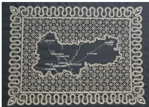
Панно «Карта Вологодской области» 2014

России, в том числе и вологодского кружева. В связи с этим событием музей приобрел кружевное панно «Сочи 2014», которое представлено на выставке. Панно выполнено в виде отдельных букв латинского алфавита и стилизованного факела. На буквах расположены фигурки спортсменов, символизирующие зимние виды спорта: слалом, хоккей, сноуборд, биатлон.