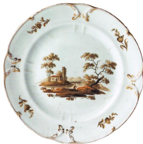
5. Тарелка с романтическим пейзажем из собрания Рыбинского музея-заповедника

В коллекции фарфора Кирилло-Белозерского музея имеются еще три предмета, в декоре которых отразилась тема романтического пейзажа. Это – чашка (К 480 КП 7266), изготовленная на заводе Кузнецова и две тарелки. Тарелка (К 162 КП 852) имеет клеймо неизвестного нам производителя. (Фото 4) На зеркале изделия романтический сюжет, в основе которого, средиземноморский пейзаж, повторяющий тему росписи чашки, из интересующей нас чайной пары. Это сходство позволяет объединить данную тарелку и чайную пару в интерьере экспозиционного пространства. Зеркало и край