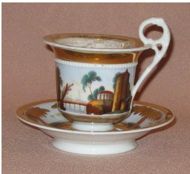
1. Чайная пара с изображением романтического пейзажа из собрания Кирилло-Белозерского музея-заповедника

Фарфор в собрании Кирилло-Белозерского музея представлен памятниками XVIII (?) - XX веков, поступившими из близлежащих монастырей, окрестных приходских храмов, из домов и различных общественных организаций Кирилловского и Белозерского районов, из частных собраний. Начало формирования коллекции, как впрочем, и всего фонда Кирилло-Белозерского музея было положено в 1924 году. Во второй половине XX - начале XXI столетий фонд керамики значительно увеличился за счет новых поступлений. Коллекция фарфора музея сравнительно небольшая, насчитывающая