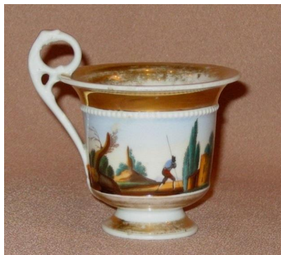
2. Чашка из собрания Кирилло-Белозерского музея-заповедника

Приведем описание этих предметов. Чашка (высота – 10,3 см, верхний и нижний диаметры – 11 и 9,2 см), цилиндрической формы, на конусовидной ножке, с отогнутым наружу краем борта. (Фото 2) В верхней части тулова, над росписью, она декорирована белым рельефным пояском в виде вдавленных в основу чередующихся бусин. Высокая поднимающаяся над туловом изогнутая ручка завершена сверху рельефным кольцом с петелькой. На тулове чашки показан романтический пейзаж: два берега реки и перекинутый между ними мост с перилами. На правом берегу изображены