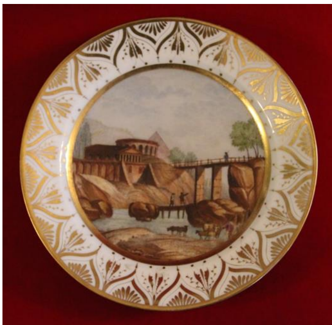
4. Тарелка производства завода Попова из собрания Рыбинского музея-заповедника

Отечественной войны 1812 года. Большой популярностью пользовались жанровая скульптура, вещи, изготовленные в восточном стиле, а также изделия с лиричными изображениями. Посуду украшали рельефными деталями, позолотой, изящным орнаментом. Наряду с разнообразными цветочными мотивами, художники наносили на фарфор пейзажи, копировали картины знаменитых мастеров, портреты знаменитых лиц, изображали сцены из литературных произведений, тонкие абрисы, силуэты, часто заимствуя