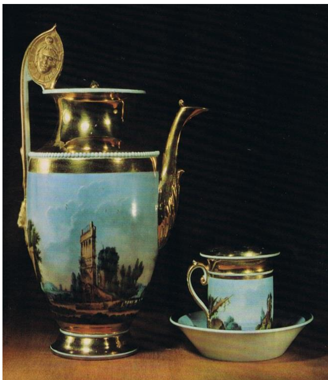
8. Предметы из сервиза из коллекции музея «Государственный Эрмитаж». Вторая четверть XIX века

разнообразен. Здесь изготавливали как фарфор для повседневной сервировки стола, так и уникальные произведения искусства, украшавшие дворцы. Среди изделий с маркой «Гарднер» часто можно встретить предметы, повторяющие европейские образцы. Это особенно было характерно для продукции завода, производимой в первые десятилетия его существования.