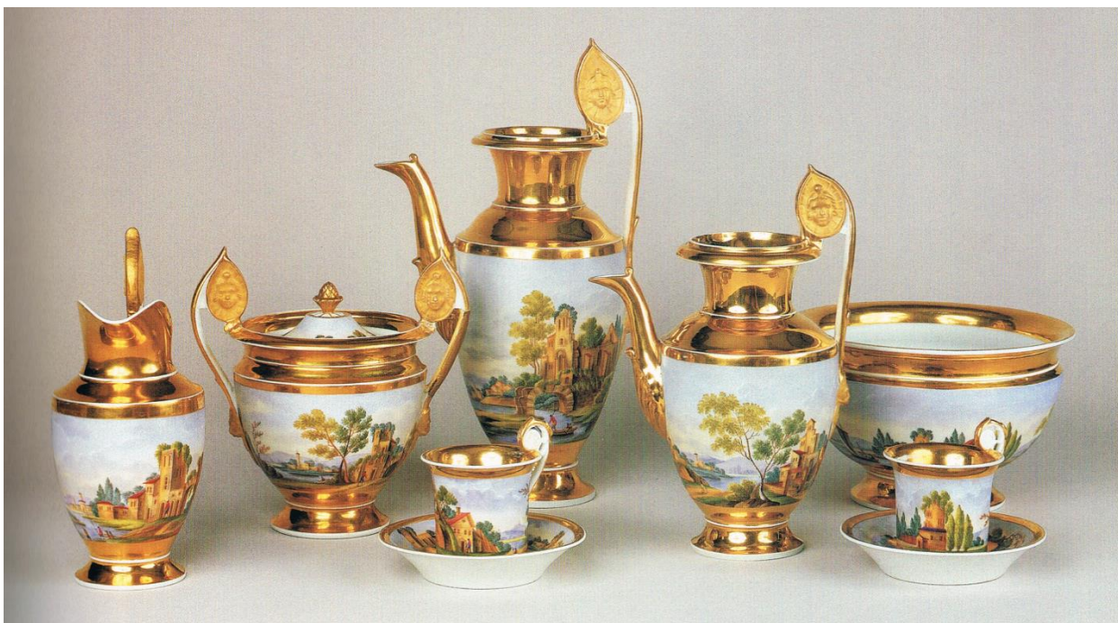
10. Сервиз с пейзажами из коллекции Русского музея. Фабрика Гарднера 1820-е годы

протяжении всего XIX века. Подобную продукцию отечественные предприятия выпускали и для внутреннего потребления и на экспорт, ориентируясь на разные рынки, включая восточное направление. Ассортимент заводов отличался большим разнообразием и соответствовал запросам любого потребителя.