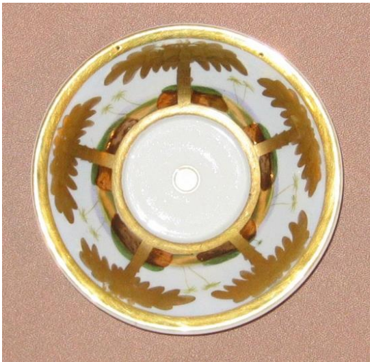
3. Блюдце из собрания Кирилло-Белозерского музея-заповедника

архитектурные постройки и деревья. На левом – среди холмов, поросших кустарником, и зданий, окруженных кипарисами, написана фигурка человека с высокой тонкой тростью, идущего по равнине. Роспись исполнена в теплых охристых тонах с использованием зеленого, нежно-голубого и красного цветов. По краю основания чашки и по нижней части ее тулова, по внешнему краю борта сделаны отводки широкими золотыми лентами. Позолота, частично сохранилась на внутренних стенках тулова предмета.