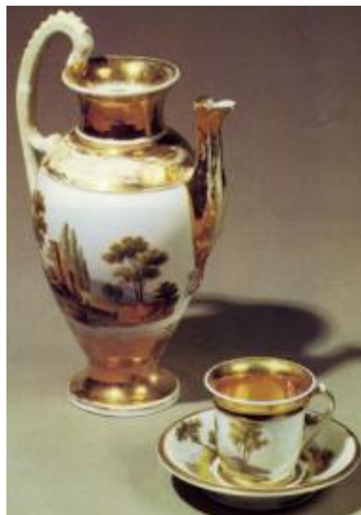
7. Кофейник и чашка с блюдцем первой трети XIX века из коллекции Государственного музея-заповедника «Ростовский кремль»

Фабрика Гарднера была основана в 1766 году английским купцом в подмосковном селе Вербилки. В истории русского фарфора этому производителю принадлежит значительная роль. До середины XIX века «гарднеровский фарфор» не имел соперников и мало уступал по качеству саксонскому фарфору, считавшемуся эталонным. Ассортимент фабрики был необычайно