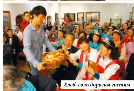
Хлеб-соль дорогим гостям