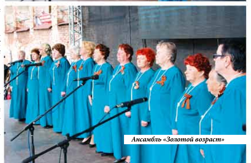
Ансамбль «Золотой возраст»