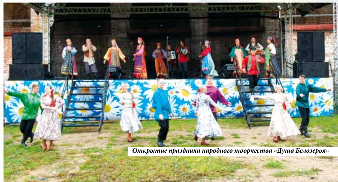
Открытие праздника народного творчества «Душа Белозерья»