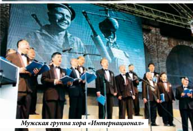
Мужская группа хора «Интернационал»