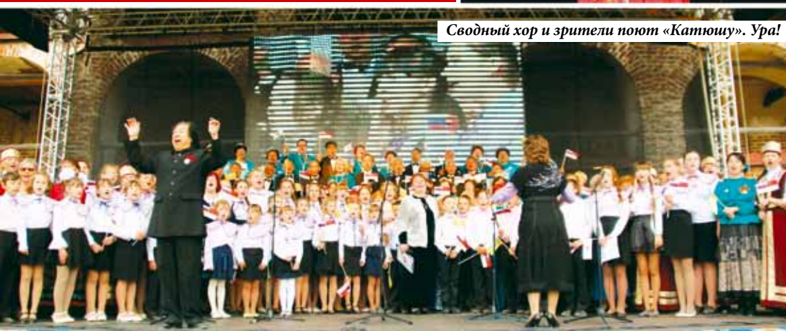
Сводный хор и зрители поют «Катюшу». Ура!

Вот она живая связь поколений! Фестиваль объединил хоры общественные, хоры самодельные! Наряду с ветеранами на сцене выступают дети! Это и есть передача культуры – от поколения к поколению, от дедов – к отцам, и от отцов – к детям.