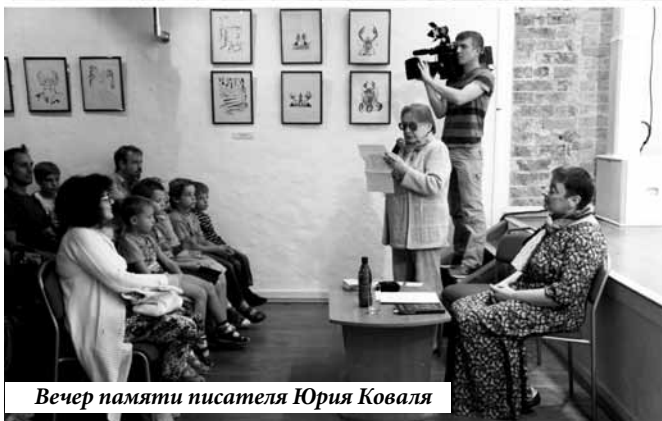
Вечер памяти писателя Юрия Ковалю