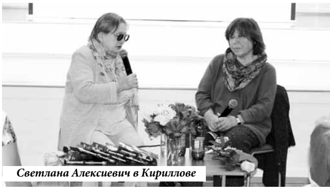
Светлана Алексиевич в Кириллове