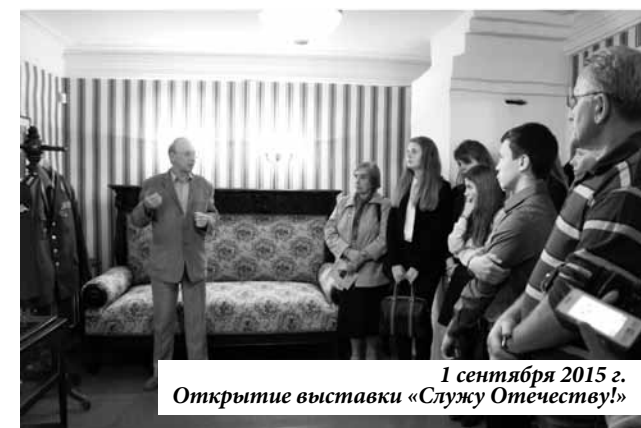
1 сентября 2015 г. Открытие выставки «Служу Отечеству!»