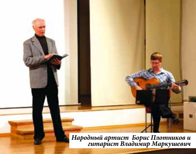
Народный артист Борис Плотников и гитарист Владимир Маркушевич