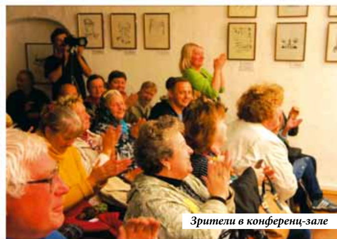
Зрители в конференц-зале