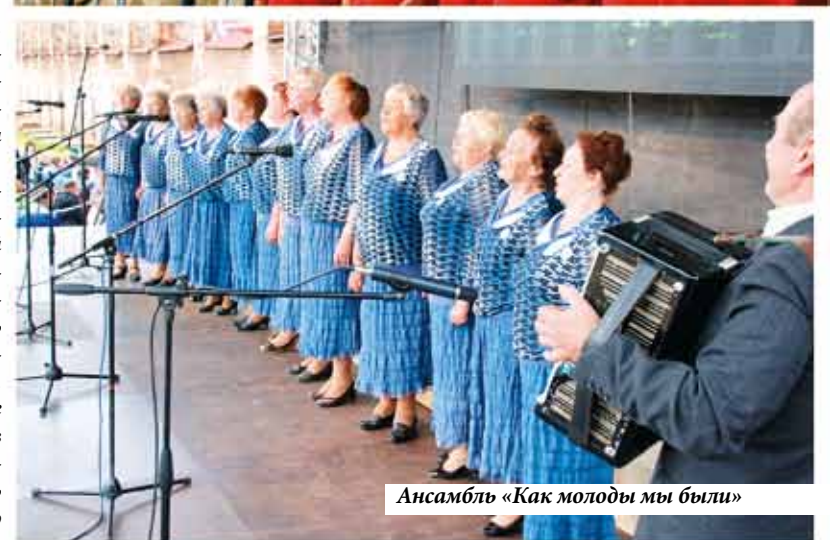
Ансамбль «Как молоды мы были»