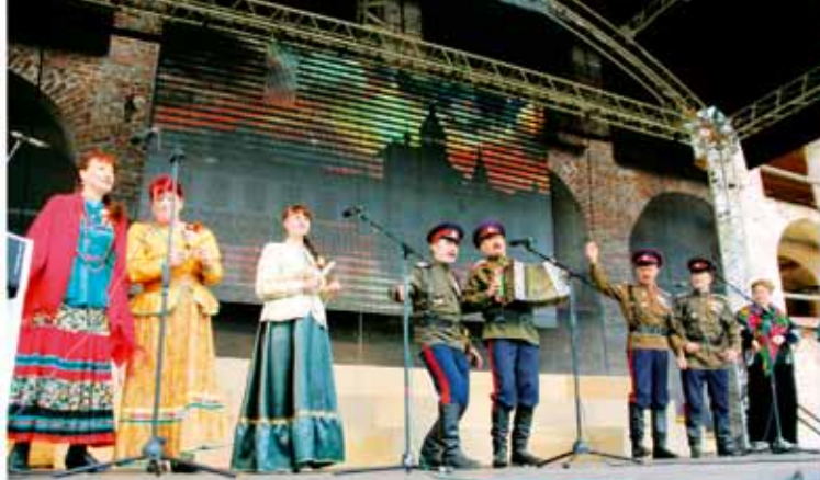
Казачий ансамбль «Серебряная подкова»