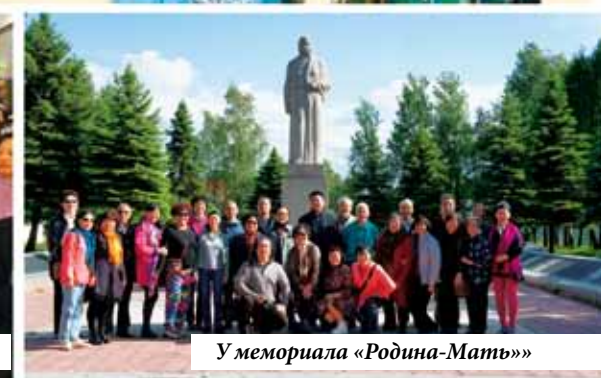
У мемориала «Родина-Мать»»