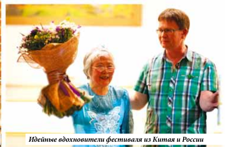
Идейные вдохновители фестиваля из Китая и России