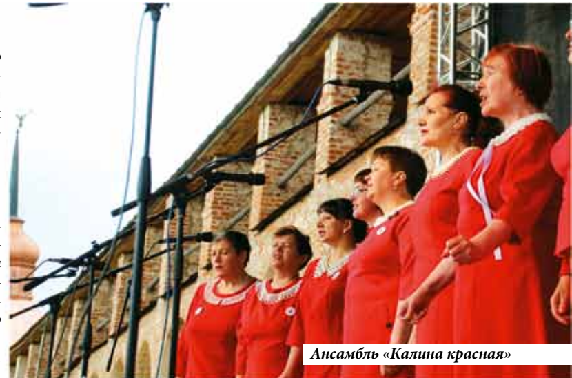
Ансамбль «Калина красная»