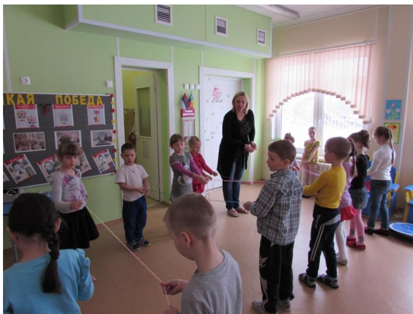
Фотография 2. Мастер-класс «Узорный пояс»

Детей познакомили с устройством русской избы – жилищем крестьянской семьи, с предметами старинного русского быта (печь, прялка, посуда, коромысло и т.д.), с историей и особенностями русского народного костюма и его обязательного элемента - пояса, с символическими значениями вышивки. Дошкольники научились плести пояс в хороводе и на «ромашке» (Фотография 2).