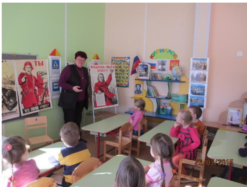
Фотография 4. «Художники о войне»

Дети приняли участие в конкурсе «Великая Отечественная война в истории моей семьи», проводимым Кирилло-Белозерским музеем-заповедником. Конкурс детского рисунка был посвящен 70-летию Победы советского народа в Великой Отечественной войне 1941-1945 годов. Дошкольники приняли активное участие в конкурсе в младшей возрастной группе.