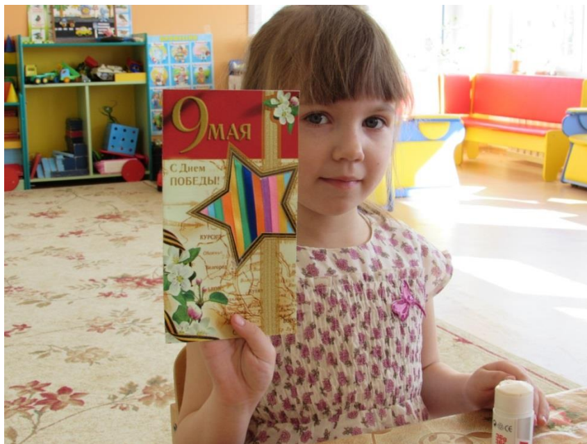
Фотография 3. Мастер-класс «Открытка к 9 Мая»

жители Кирилловского района сражались на фронте и работали в тылу. Дошкольников познакомили с произведениями искусства, посвященными войне. Они также побывали на выставке «Письма военных лет».