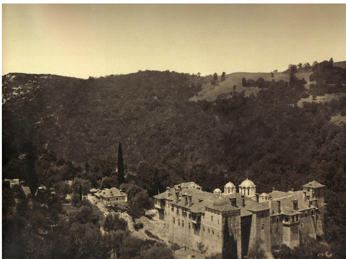
Илл. 2. Канстамонитов монастырь. 1867–1872.

Так закончилась жизнь архимандрита Феофана Канстамонитова монастыря.