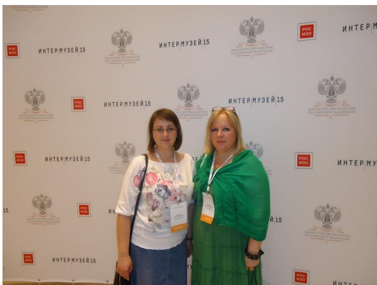
В последний день работы фестиваля

Гран-При фестиваля присудили историко-культурному комплексу «Вятское» за реализацию потенциала культурного наследия в развитии региона. В номинации «Лучший музейный архитектурный проект» победил музей-заповедник «Куликово поле» с музейным комплексом «Поле Куликовской битвы». Лучшим проектом, направленным на сохранение нематериальной культуры объявлен Егорьевский историко-художественный музей с проектом «Провинциальный эксперимент». Приз за лучший образовательный проект получил Государственный музей изобразительных искусств Республики Татарстан за проект «Сокровище моё!». Лучшим проектом в туристической сфере назван Государственный музей истории религии с проектом «Музейный квартал в Санкт-Петербурге». По работе с региональным сообществом приз получил литературный марафон «Каренина. Живое издание» (Государственный мемориальный и природный заповедник «Музей-усадьба Л. Н. Толстого «Ясная Поляна»).