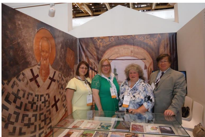
В день открытия фестиваля на стенде музея

Тема фестиваля звучала как «Развитие музея – развитие территории». По мнению организаторов, главная идея – показать роль музеев в формировании его окружающей территории и культурного пространства. Мероприятие проходило в центральном выставочном зале Манежа в Москве с 11 по 15 июня. Его участниками стали 135 музеев, представленные на стендах.