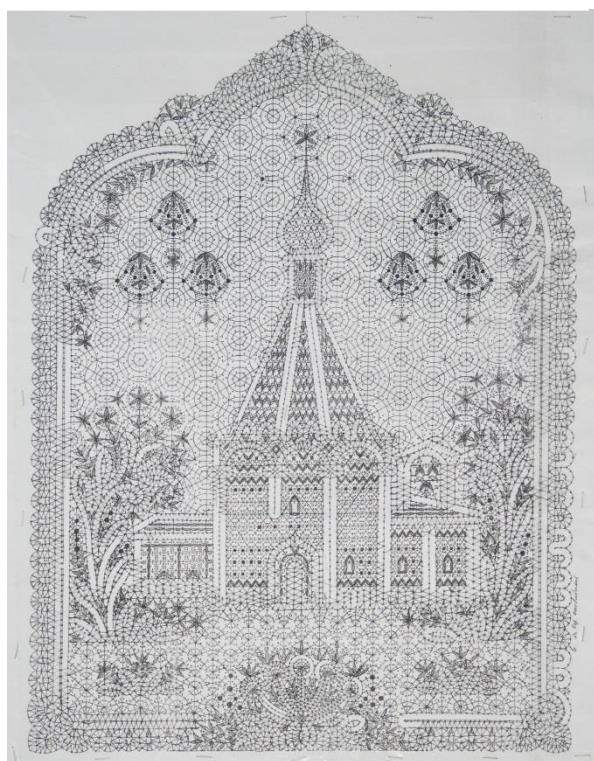
Технический рисунок к панно «Северный звон» Г.Н. Мамровской. 2009 год

Так, в 2014 году по заказу музея в фонды поступил кружевной триптих, выполненный Г.Н. Мамровской, посвященный ансамблю Кирилло-Белозерского монастыря, вместе с техническими рисунками к нему: «Мелодия вечности» 3 , «Светлая тишина» 4 , «Северный звон» 5 . Над эскизами и кальками с детальными прорисовками Галина Никитична работала долгое время, скрупулёзно продумывая каждую деталь произведения. Очень грамотно вписаны в растительный узор стилизованные изображения церквей, башен. Сдержанная графика архитектурных памятников в панно смягчается множеством декоративных разработок. Прямоугольная форма завершается пятью полукружьями и напоминает закомарные покрытия храмов. Панно было представлено вместе с авторскими рисунками на персональной выставке «Мелодия вечности», посвященной творчеству художницы в Казенной палате Кирилло – Белозерского музея - заповедника.